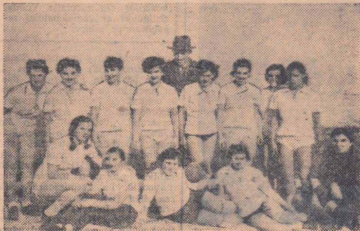
Tînerele handbaliste din Mija, zîmbesc fericite. Au și de ce: la anul vor juca în cadrul categoriei A.

Dan Cucu și M. Bedrosian (corespondenți)