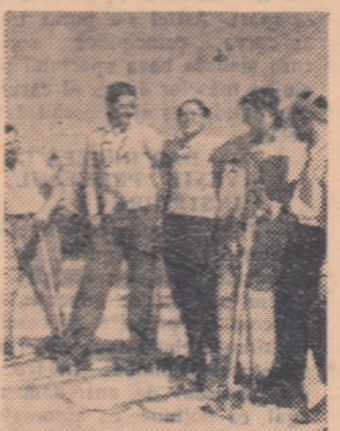
Deși iarna nu și-a trimis prelungirea vestitorii, pregătirile participanților la Spartachiada de iarnă a tineretului sînt încheiate. Și cînd zăpada se va așterne peste plaiuri, ei vor cunoaște aceeași însuflețire ca și tinerii din fotografie. Cu avînt și voioșie, ei se vor întreci pe pîrtii!