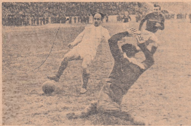
Toma a ieșit din poartă și plonjează. Nicușor însă va ridica mingea peste portar și va marca.