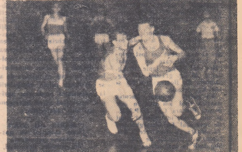
Din pînăte faze spectaculoase și interesante de baschet cu ocean din fotografia noastră, nu mai pot fi văzute săptămîniile acestea Baschetul ia o vacanță prea mare tocmai în plin sezon!

Socotim că revizuirea după propunerile de mai sus a programării campionatelor de baschet poate asigura o continuitate în activitatea echipelor noastre de frunte, le poate menține într-o continuă pregătire în lunile cînd și programul internațional cunoaște o mare intensitate și poate mări interesul pentru întrecerea din campionat prin apropierea turului de retur. Și, ca ultim argument, de ce să nu folosească baschetul un mare avantaj, acela de a „monopoliza”, atenția și interesul opiniei sportive?