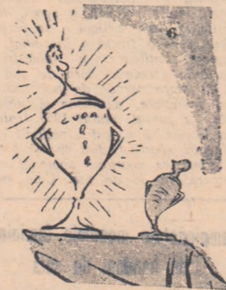
Cupa R.P.R. — Nu știu, dacă mă înțelegi, dar fără dia din A, e ca și cum mi s-ar lua tot lucrul.