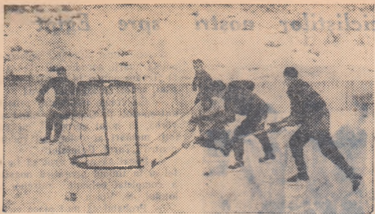
A început activitatea oficială la hochei pe gheață. Insa, cu mult înainte echipele noastre și-au început pregătirile. Iată o fază de la un antrenament.