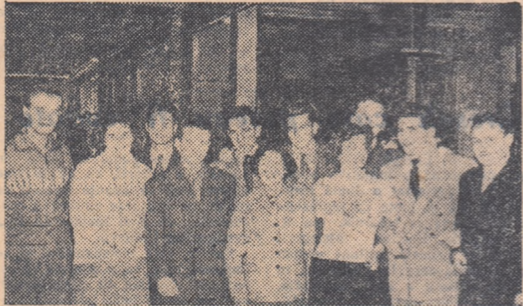
Emisarii sportivi a nouă țări se vor întâlni în pasionanta luptă sportivă a campionatelor internaționale de tenis de masă ale țării noastre.

A trebuit să ne întocmim cu multă chibzuință orariul deplasărilor pentru a prinde la antrenamente sau a discuta — „printre picături“ — cu protagoniștii ediției de anul acesta a campionatelor internaționale de tenis de masă ale țării noastre. În ultimele două zile, de când majoritatea oaspeților au sosit în București, făcând legătura între sala Floreasca (locul de desfășurare al acestor întreceri) și hotelul „Ambasador“ (unde sînt găzduiți toți participanții) am rețut parcă atmosfera competiției de neuitat, campionatele mondiale