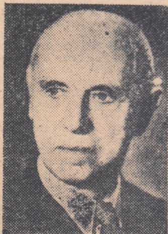
Acad. prof. dr. C. I. PARHON propus candidat al F.D.P. în circumscripția electorală „6 Martie“