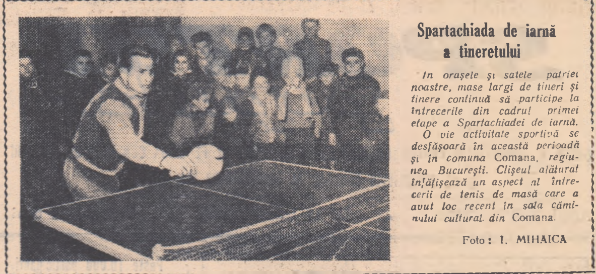
Spartachiada de iarnă a tineretului

Sportivul cetățean al Republicii Populare Romine se bucură de înalte drepturi cetățenești consfințite prin Constituția țării și garantate în fiecare moment de legile statului democrat-popular. Aceste drepturi sînt pe deplin folosite de fiecare sportiv. În întimpinarea alegerilor de deputați în Marea Adunare Națională, sportivii își dovedesc hotărîrea de a-și exercita aceste drepturi prin entuziasmul creator cu care muncesc în producție, prin participarea la numeroase competiții închinate zilei de 3 februarie, printr-o activitate susținută de agitație și propagandă în scopul asigurării victoriei depline a Frontului Democratiei Populare în alegeri. Astfel sprijină sportivii — prin fapte — votul pe care-l vor da, cu încredere, candidaților F.D.P., celor mai buni filii ai poporului.