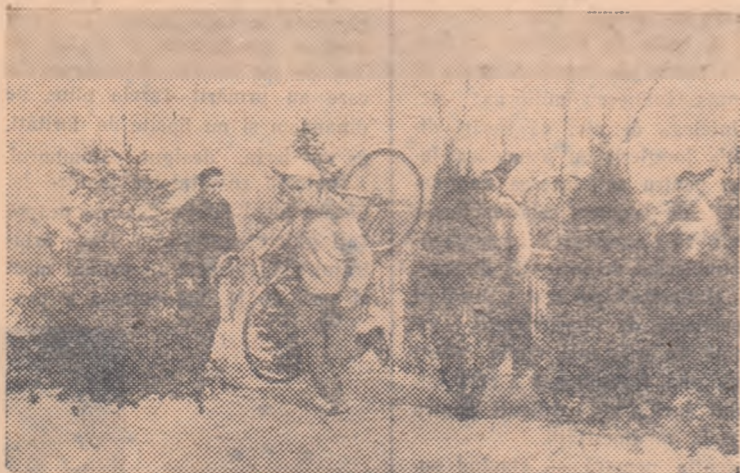
Cicliștii asociației Recolta profită de vremea favorabilă și se antrenează — în aer liber — sub supravegherea antrenorului C. Grigoriu. În primul plan D. Dragomir.