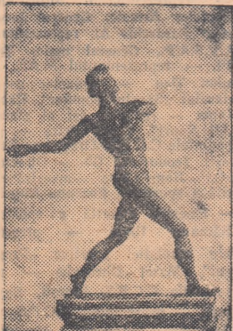
„Aruncătoarea cu subțea” (încă în lucru)

C. Iordache-Brăila este unul din sculptorii care au îmbrățișat cu multă dragoste vastul „teren” de inspirație pe care-l reprezintă lumea sportivă.