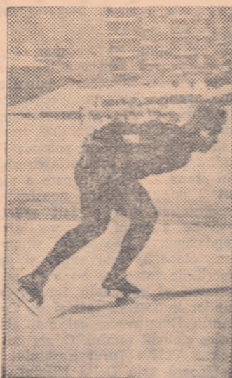
Rafael Graci, este la ora actuală unul din cei mai buni sprinteri ai lumii.

■ Tradiționalul concurs de patinaj viteză de la Alma-Ata, dotat cu premiul Consiliului de Miniștri al R.S.S. Cazare, s-a desfășurat în acest an pe patinoarul de șes Spartak din localitate, deoarece pista de altitudine de la Medeo a fost avariata de o avalanșă și se află în curs de reamplasare. Cu toate acestea, concursul a fost marcat de o serie de performanțe excepționale, neobișnuite pe un patinoar de șes și care pot concura cu rezultate obținute pe gheața de mare altitudine de la Medeo, Davos, sau Cortina.