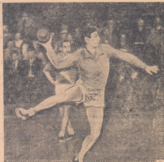
★ ★ ★ Lovitură de 7 m. la poarta Energiei Ploiești! Fază din meciul Dinamo 6 — Energia Ploiești, desfășurat duminică după-amiază în sala Floreasca. ★ ★ ★

ORAȘUL STALIN. — Feminin: Flamura roșie Sibiu — Energia Mîja 11—4 (4—2). Recolta Codlea — Progresul Tg. Mureș 4—4 (4—2) într-un meci în care Recolta putea cîștiga dacă n-ar fi greșit retrăgîndu-se în apărare în repriza a doua. Fl. r. Mediaș — Fl. r. Buc. 6—16 (4—10). Masculin: Progresul Or. Stalin — Fl. r. Ghimbav 28—24 (16—13). Știința Or. Stalin — Voința Sighișoara 20—22 (10—9). Voința Sibiu — Energia Făgăraș 20—28 (8—16). Dinamo Or. Stalin — Recolta Hălchiu 6—0 (neprezentare).