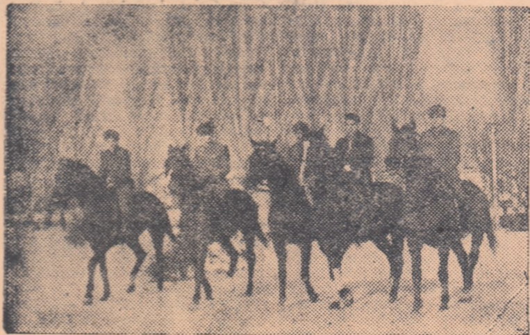
Lucrul la maneje este completat cu antrenamentele în aer liber. Și de această dată, kilometrii parcurși sînt reprezentați printr-o cifră impresionantă.