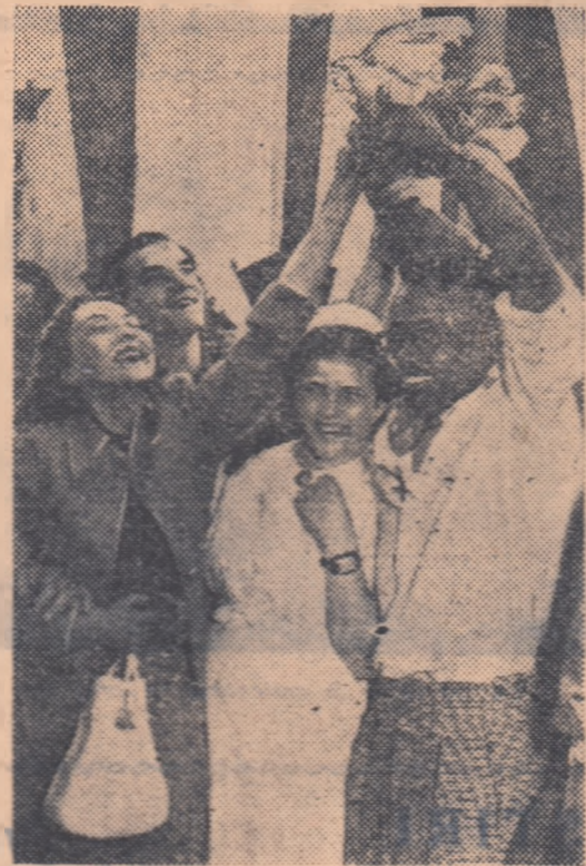
Festivalurile Mondiale ale Tineretului s-au transformat de fiecare dată în manifestații emoționante de prietenie și frație între tinerii din toată lumea. Iată o imagine elocventă!

Sportul, care se încadrează, de asemenea, în rindul necesităților culturale ale omului, nu este de loc sprijinit, supus discriminării. Și totuși, nu odată populația de culoare a dovedit vitalitatea sa, marile sale posibilități și resurse. Doi algerieni, El Omali și Mimoun au purtat pe culmile cele mai înalte ale atletismului francez. Alergatorul de culoare din Trinidad, Mc. Donald Bailey a adus glorie