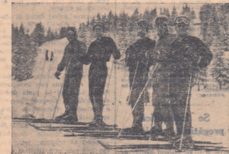
Lotul schiorilor austrieci participanți la concursul internațional de schi de la Sinaia este gata pentru antrenament.

Duminică s-a încheiat în Capitală primul concurs de triatlon al anului. Cu această ocazie a fost verificat stadiul actual de pregătire a pentatloniștilor consacrați și, totodată, au debutat în concursuri de acest gen o seamă de tineri bucureșteni. Și într-un caz și în celălalt rezultatele sînt promițătoare. Pentatloniștii s-au comportat mai bine decît în primul concurs de anul trecut, ceea ce denotă creșterea lor valorică, iar numărul începătorilor (cca 20) a întrecut așteptările mai cu seamă în condițiile timpului total nefavorabil. Consecrații n-au putut fi în-