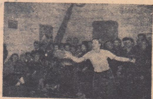
În sala Progresul F.B. a avut loc duminică dimineața etapa pe Capitală a Spartachiadei de iarnă a Tineretului. În clișeu: o fază de la întrecerile de tenis de masă.