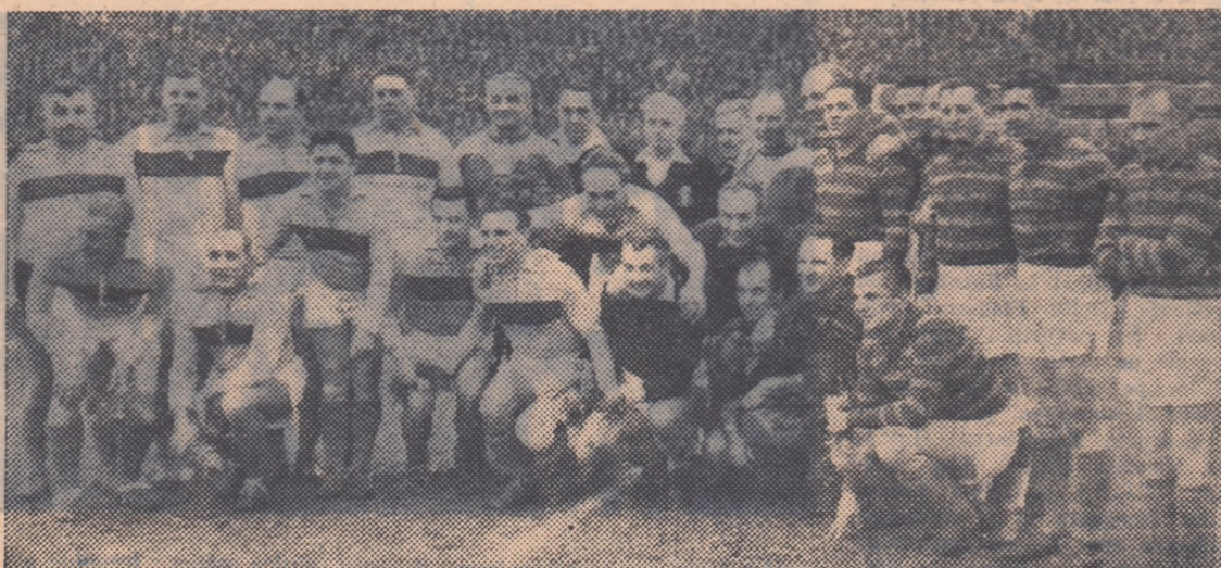
Din nou laolaltă, după 20 de ani și pe același teren!... Fostele glorie ale fotbalului nostru zimbesc fericiți că se reîntânesc în jurul balonului rotund și în fața unui public numeros, cum n-au avut niciodată pe timpul când erau jucători...