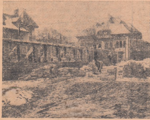
În imediată apropiere a școlii se construiește o bază sportivă complexă, care va cuprinde o sală de gimnastică, terenuri de volei și baschet, o pistă de atletism, precum și vestiare cu instalație sanitară adecvată.

În fotografie, un aspect de pe șantierul bazei.