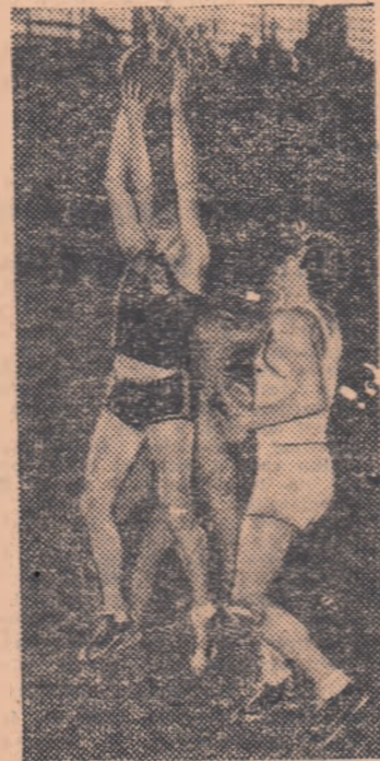
O fază din meciul de baschet MAVAG-MAFC din cadrul „Cupei de iarnă” desfășurat recent la Budapesta

ghiar este ridicarea și pregătirea tinerilor cadre. Nu începe îndoială că prin priceperea antrenorilor maghiari, renumiți în întreaga lume, se va ridica în scurt timp o nouă și excelentă gardă de fotbalști, atleți, scrimeri și jucători de polo.