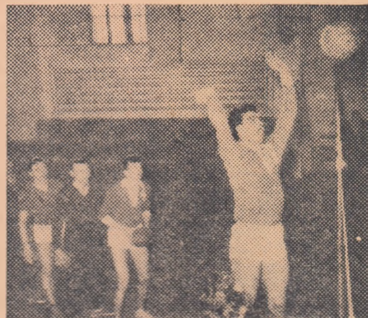
Aspect de la antrenamentul făcut ieri în sala Giulești de voleibaliștii de la Locomotiva

Am prezentat în numărul trecut câteva aspecte ale pregătirilor echipelor provinciale de volei. Ne-am gândit că ar fi interesant și un „tur” prin sălile de sport bucureștene pentru a lua cunoștință de stadiul antrenamentelor echipelor din Capitală.