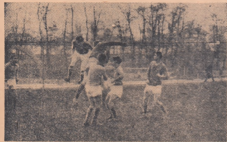
Fază din meciul de antrenament disputat joi între Dinamo București și Energia „T. Vladimirescu”.