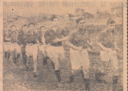
Proaspăt promovată în campionatul orașenesc, echipa de fotbal a colectivului Energia „Electrofar” se pregătește în vederea campionatului

În cei aproape doi ani care s-au scurs din ziua cînd micul cerc sportiv al fabricii „Electrofar” își trecea „examenul de maturitate” și pășea, independent, la transpunerea în viață a unui plan îndrăzneț de învioreare a activității sportive, succesele n-au întârziat să se facă cunoscute și astăzi