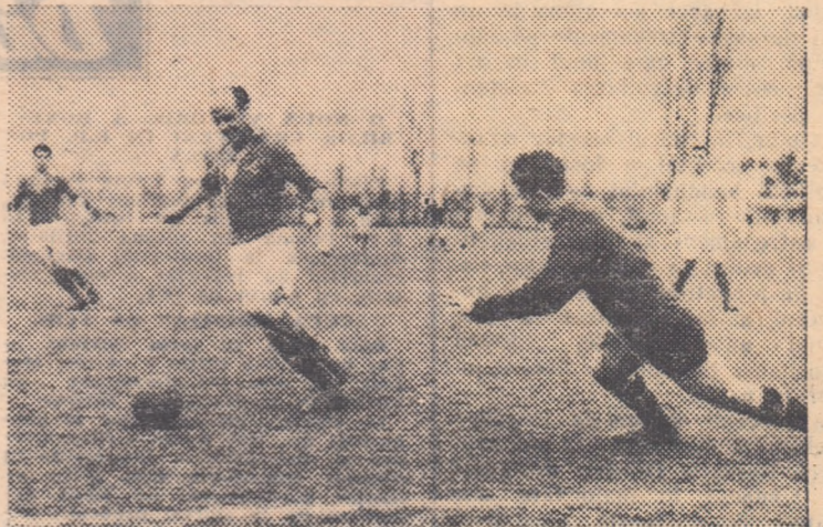
Filote a fost unul dintre animatorii partidei amicale dintre echipele bucureștene Locomotiva și Știința

o verificare serioasă pentru fiecare dintre ele. Cu acest prilej ne vom da seama și de gradul de pregătire al jucătorilor selecționați, iar constatările ne vor indica ce avem de făcut în viitor”.