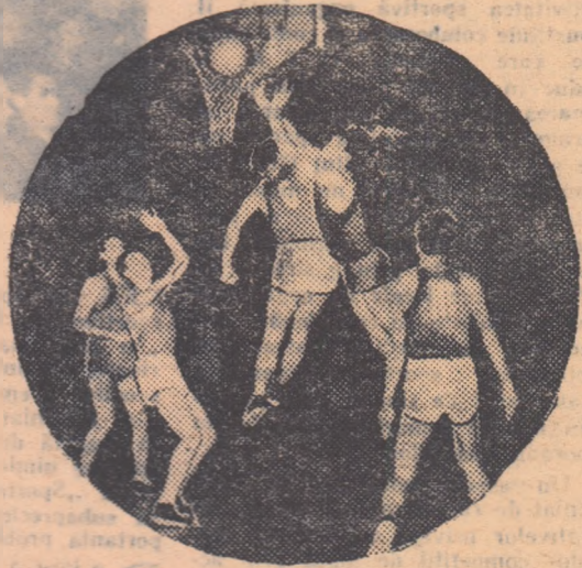
Uneori este destul de greu să împiedeci atacantul să înscrie. Fotografia noastră este elocventă.

În campionatul republican, echipele masculine își dispută jocurile