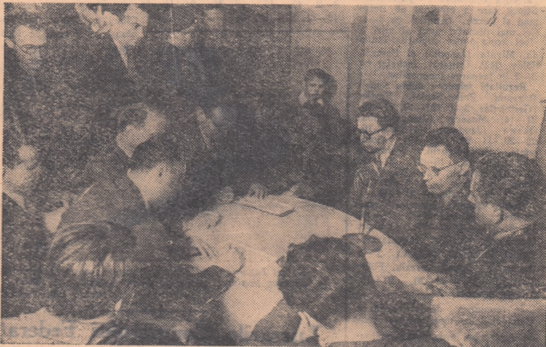
Înainte de deschiderea meciului lor, Botvinik și Smislov răspund întrebărilor ziaristilor.

Rămîne de văzut dacă și Botvinik este de aceeași părere. Cum meciul se află abia la început, credem că orice pronostic este hazardat.