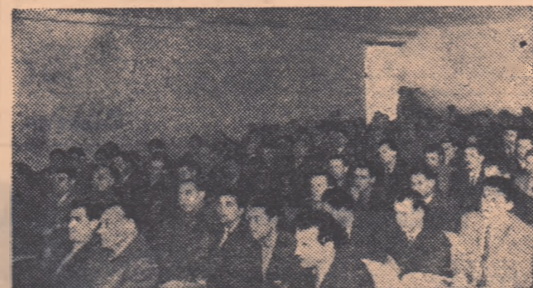
Aspect din sală, în timpul ședinței.

Riferindu-se la problemele agitației și propagandei sportive, vorbitorul a arătat că, deși inițiativele locale n-au lipsit, această activitate s-a menținut la un nivel scăzut, n-au fost folosite toate mijloacele existente, iar unele probleme ca de pildă popularizarea experienței unor comitete