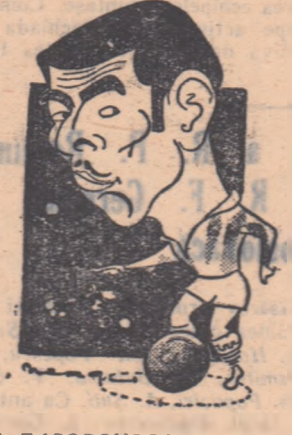
D. TASOPOULOS interul dreapta al echipei Makedonikos, care astăzi joacă la Sibiu cu Progresul din localitate.

Parte dintre arbitri n-au reușit să mulțumească în acest in-