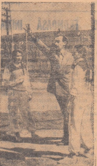
„Așa se execută proba de aruncare a greutății!” Indemnului antrenorului este ascultat cu atenție de aceste viitoare participante la Spartachiadă.