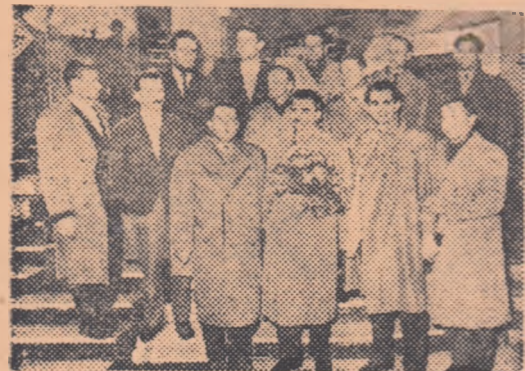
La câteva minute după sosire, în holul hotelului Ambasador jucătorii echipei Medvedgrad Zagreb zîmbesc obiectivulul foto reporterului nostru.