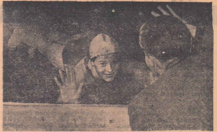
Ce se va întîmpla, însă, cu bazinele mai mici de 50 m?... În ele se vor pregăti, mai departe (așa cum se poate vedea și din fotografia noastră) viitorii recordmani.

Profesor de educație fizică la Școala profesională de energie electrică din București