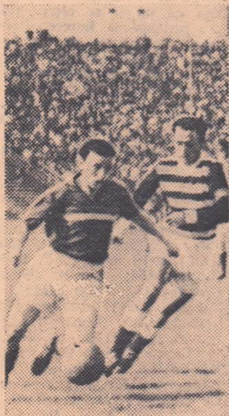
Biscă, extremul dreapta al re- prezentativei noastre de juniori, în plină acțiune.

cuprinde doar un junior din cei de anul trecut: pe Van Hemelryck; în rest, probele nouă. Primul joc de trial n-a satisfăcut. Dimpotri-