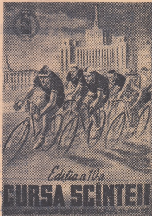
Ediția a 10-a CURSA SCINTEII