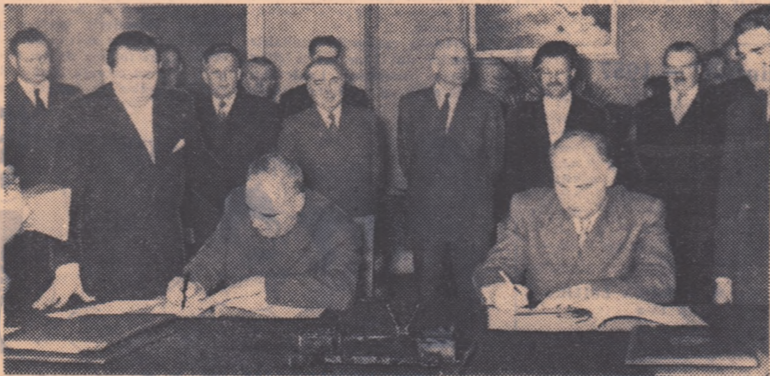
Tovarăși: Gheorghe Gheorghiu-Dej și Todor Jivcov semnează De clarifica cu privire la tratativele dintre delegațiile Partidului Muncitoresc Romîn și Partidului Comunist Bulgar.

Tratatul dintre delegațiile Parti- dului Muncitoresc Romîn și Parti- dului Comunist Bulgar și tratati- vele între delegațiile guvernamen-