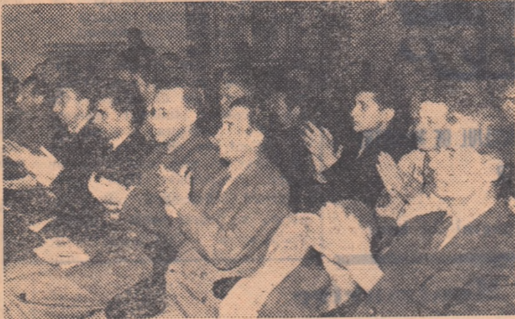
Aspect din sală în timpul consfătuirii cu cititorii și corespondenții din Capitală organizate de ziarul „Sportul popular”.

Cu prilejul Zilei presei comuniste și a apariției celui de-al 3000-lea număr, ziarul „Sportul popular” a organizat simbul după amiază o consfătuire cu cititorii și corespondenții din București. Cei 21 de cititori și corespondenți care au luat cuvîntul în această consfătuire au apreciat eforturile depuse de ziar, în cele 3000 de numere de până acum, în vederea dezvoltării și întăririi mișcării noastre de cultură fizică, a combaterii reminiscențelor mentalității burgheze reacționare, și a lipsurilor de tot felul a populației experienței sportive din țările socialismului și a demascării scopurilor și rolului atribuite sportului de către cercurile imperialiste. Vorbitorii au subliniat de asemenea unele lipsuri din activitatea ziarului și au prezentat prețioase sugestii care constituie pentru colectivul nostru redacțional un sprijin important pentru îmbunătățirea muncii noastre, pentru satisfacerea exigențelor mereu crescînde ale maselor de cititori.