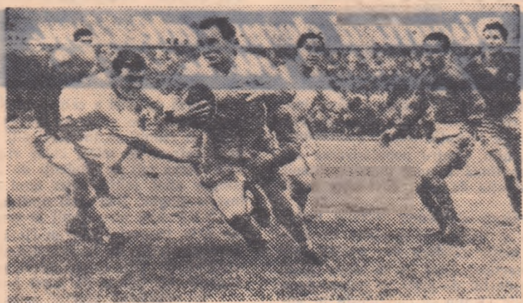
Mijlocușul la grămadă Jeeps, care scîpînd de placaj, va lansa un nou atac al liniei sale de trei sferuri.

Meciul a fost, în general, de o mare spectaculozitate. În primul set, jucătorii romini au fost condși cu 0-2 și 1-3, dar datorită atacurilor ireproșabile, variate și rapide, ei reface diferența și iau conducerea, cîștigînd cu 15-9. În al doilea set, echipa R.P.R. căbește forța atacului iar reprezentativa R. Cehoslovace, cu un blocaj mai prompt, conduce cu 6-1 și 9-3. Echipa noastră își revine, reface, dar nu mai poate cîștiga setul. În celelalte seturi lupta a fost de-a dreptul dramatică. Jocului în forță, cu blocaj sigur și prompt al cehoslovacilor, echipierii romini i-au spus acțiuni rapide, cu multă fantazie, cu atacuri surprinzătoare, o exceciență apărare în blocaj și în linia II-a. După o luptă impresionantă, care a entuziasmat spectatorii, după o numărare schimburi de servicii, cvotații de scor pasionante, echipa R.P.R. a cedat cu scorul de 2-3 (15-9, 6-15, 9-15, 16-14, 9-15), care reprezintă un rezultat meritoriu în fața echipei campioane mondiale. Aceasta cu atît mai mult cu cît arbitrul meciului, francezul Loctaux, a dezavantajat echipa noastră (a fluturat de cele mai multe ori imaginari mîini peste filele la blocajul echipei noastre și nu a sancționat „dublele” și „șinulele” jucătorilor cehoslovaci înainte la primirea serviciilor), fapt care reiese și din declarația arbitrului cehoslovac Kettner: „ Arbtrul Loctaux a fost foarte slab și a dezavantajat echipa romină ”.