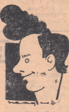
Ciupa (R. P. Polonă)

tul care cuprindea aproape în exclusivitate fotbalisții timișoreni — înaintarea — nu a corespuns. Fie că înaintașii s-au plasat prea departe