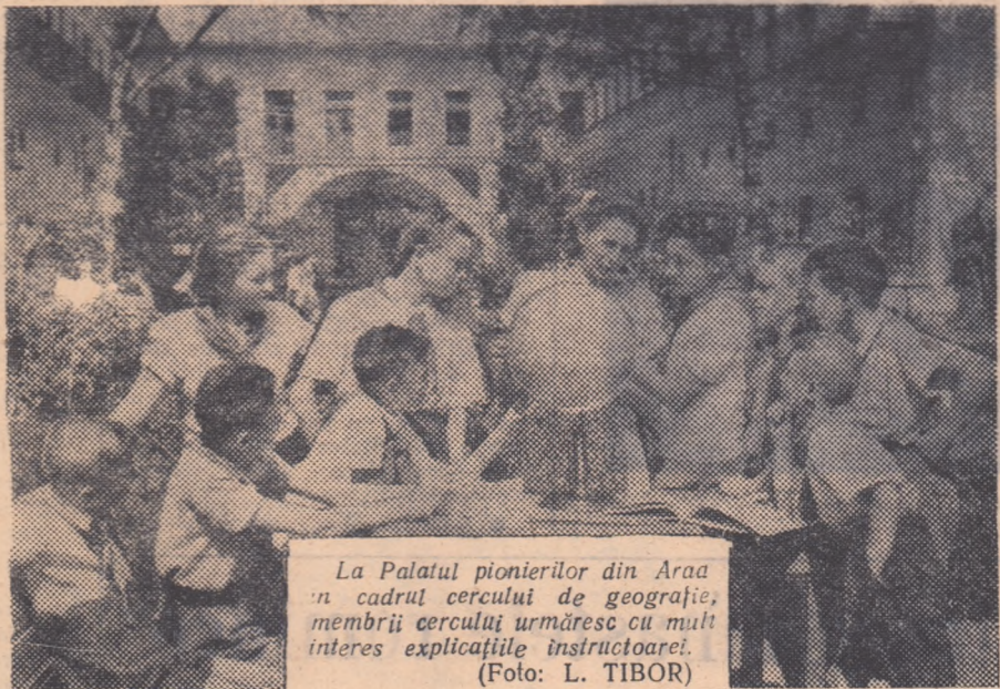
La Palatul pionierilor din Arad în cadrul cercului de geografie, membrii cercului urmăresc cu mult interes explicațiile instructorului.

Ziua Internațională a Copilului este sărbătorită sub semnul luptei hotărâte de a asigura copiilor din patria noastră o viață tot mai luminoasă, tot mai fericită.