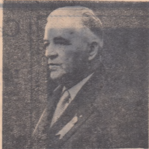
D-l Charles Thoeni, președintele Federației Internaționale de Gimnastică.

La sfîrșit președintele ne-a cerut să subliniem frumosele sale impresii asupra vizitelor efectuate în țara noastră și totodată să transmitem cordialul său salut, ospitalierilor sale gazde din această săptămînă.