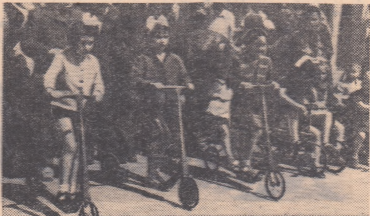
Pe stadionul din Petroșani, micușele cicliste sînt gata să ia startul in competiția organizată cu prilejul Zilei Internaționale a Copiului.

Joi 13 iunie vom publica INSEMNAȚI DIN REGIUNEA GALAȚI