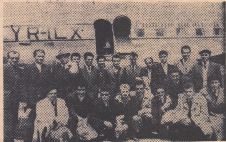
Fotbaliștii noștri, la citeva clipe după sosirea pe aeroportul Băneasa.