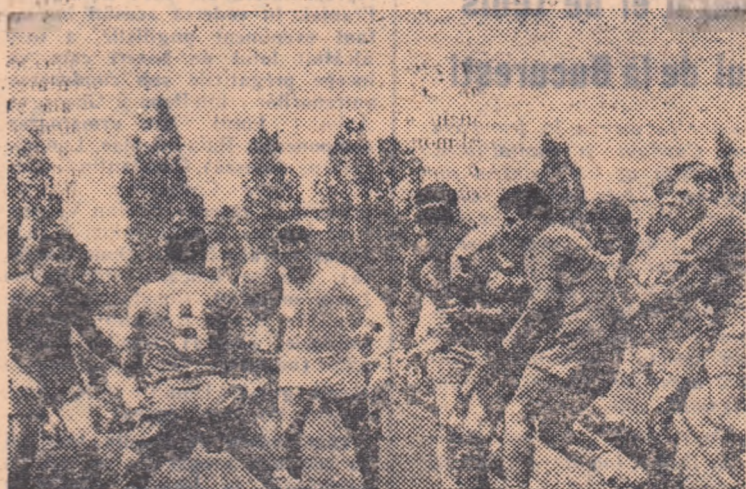
Balonul va fi preluat de Merghiescu—C.C.A. (nr. 9). Vom asista oare la un atac al liniei de trei sferturi? Din păcate, aceasta, lipsită de fantazie, nu va fructifica faza.