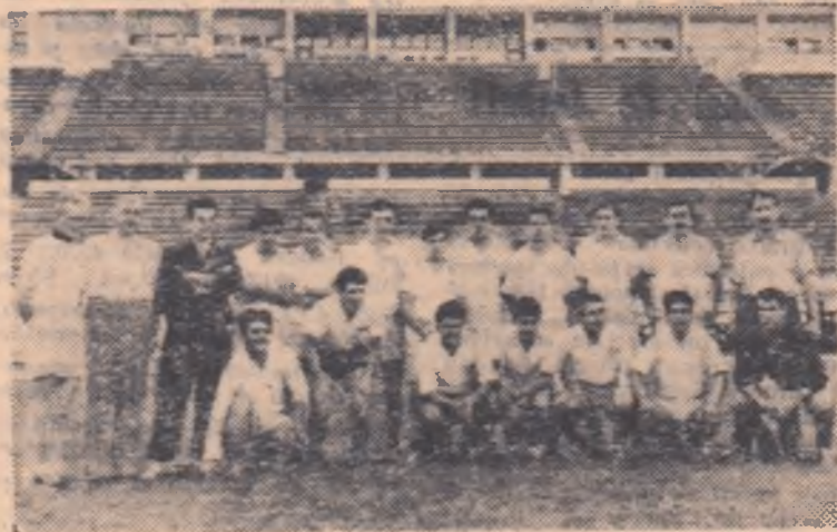
Equipele fotbalistilor greci după antrenamentul de ieri după amiază de pe stadionul Republicii. (Foto: T. LIVIU).

Mitingul a constituit o puternică afirmare a prieteniei romîno-bulgare, a hotărîrii oamenilor muncii din țara noastră de a contribui la continua întărire a marii familii a țărilor socialiste în frunte cu U.R.S.S.