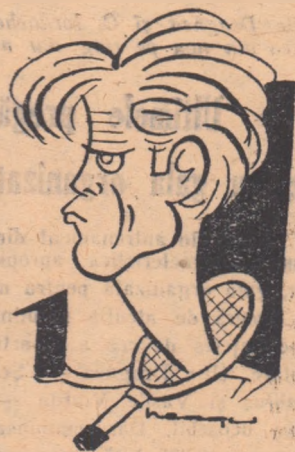
GH. VIZIRU (văzut de Neagu)

Bucaille-Kermina —, nu mai putea exista vreun dubiu în ceea ce privește rezultatul final. Mai mult chiar, după demonstrația de calitate pe care sportivele franceze au făcut-o în primul set, colabo-