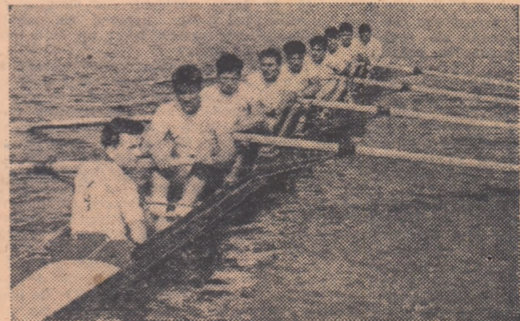
Echipajul de 8+1 al țării noastre, învingător în cursa de test