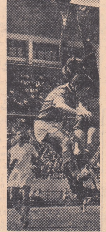
Ușu, portarul dinamovist, va prinde mingea, deși este jenat din spate de Seredai (fază din jocul Locomotiva—Dinamo 4-1). (Foto L. TIBERIU)

acest „4-1”, oricum surprinzător. Vom începe prin a sublinia forța de luptă a celor de la Locomotiva, ritmul deosebit de rapid pe care l-au imprimat jocului pînă aproape de sfîrșit. Acestea au fost principalele arme ale „locomotiviștilor” în meciul de ieri și le-am apreciat cu atît mai mult cu cit această risipă de energie se producea pe o zăpușeală cumplită și la numai două zile după ce echipa din Giulești susținuse un meci. A existat, totodată, în echipa Locomotivei un bun echilibru între compartimente, ceea ce a contribuit ca acțiunile de atac și cele de apărare să se situeze la același nivel, în general bîn. În asemenea condițiuni și remarcările sînt mai greu de făcut, dar nu credem că