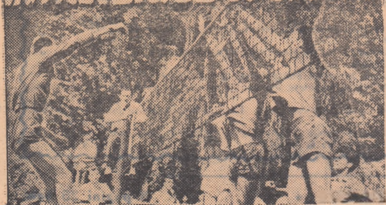
Numeroșii spectatori au aplaudat echipele de volei ale I.C.F. și Institutului de Construcții București, pentru jocul frumos pe care l-au prestat. În fotografie, un aspect de la această întîlnire

Sîntem convinși că mulți dintre cei peste 50.000 de spectatori care au aplaudat, duminică, pe Stadionul „23 August” frumoasa defilare a studenților și jocul dinamic al Științei Cluj cu echipa cehoslovacă Spartak Hradec-Kralove au fost curioși să urmărească în continuare manifestațiile sportive din cadrul Festivalului de încheiere a anului universitar. Cei care au făcut-o n-au avut ce regreta, pentru că întrecerile finale ale campionatelor universitare poartă pe deplin tinereții și drăznenii participanților, a voinței lor de a-și reprezenta cu cinste facultatea, institutul.