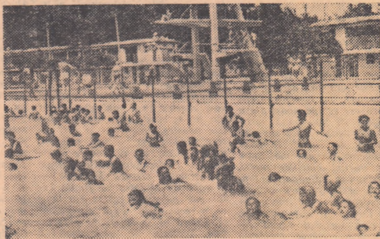
Momente de repaus la centrul de inițiere în inotului „Dante Gherman”.