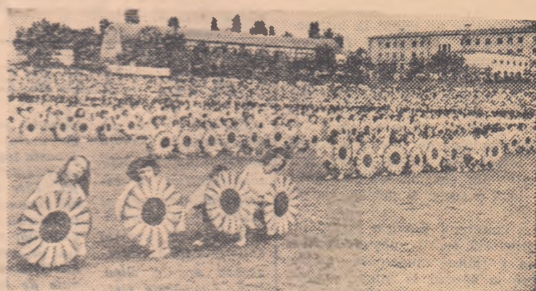
Demonstrația de gimnastică din cadrul festivității de încheiere a întrecerilor cultural-sportive studențești a cucerit spectatori prin frumusețea și măiestria exercițiilor ce le-a cuprins. În fotografie, un aspect sugestiv de la această demonstrație.