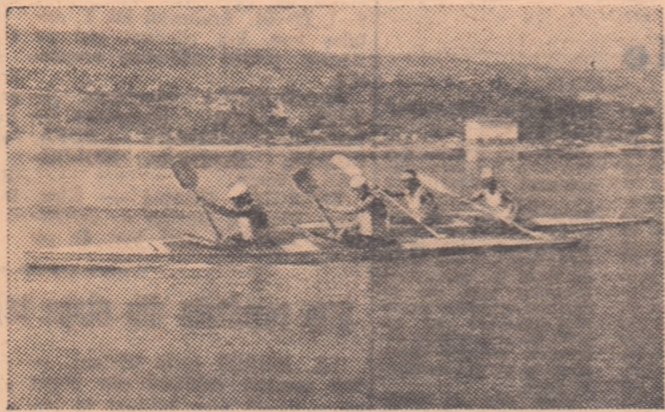
În ciuda căldurii caniculare, întrecerile canoaiștilor sînt foarte disputate.