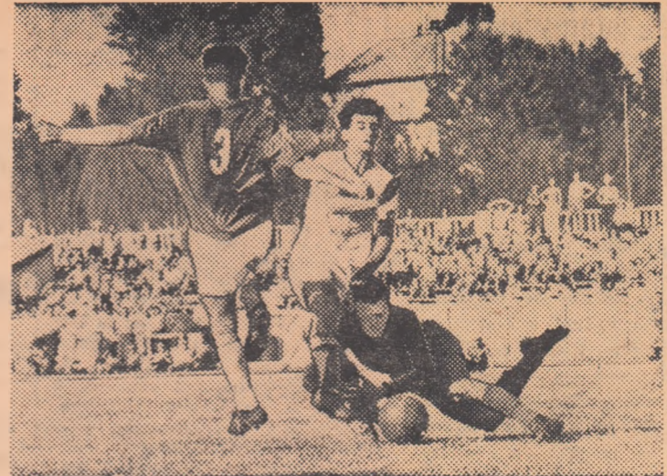
Fază din meciul Progresul Sibiu — Energia Cimpia Turzii.