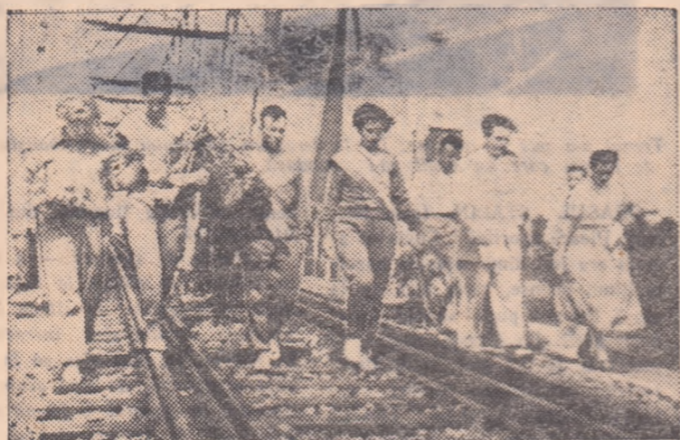
Primii pași pe pământul sovietic și, bine înțeles, primele emoții ce le încearcă toți membrii delegației romine de tineret înaintea predării către tineretul sovietic a Ștafetei Internaționale a Festivalului.

Materialele au fost redactate de OCTAVIAN GINGU.