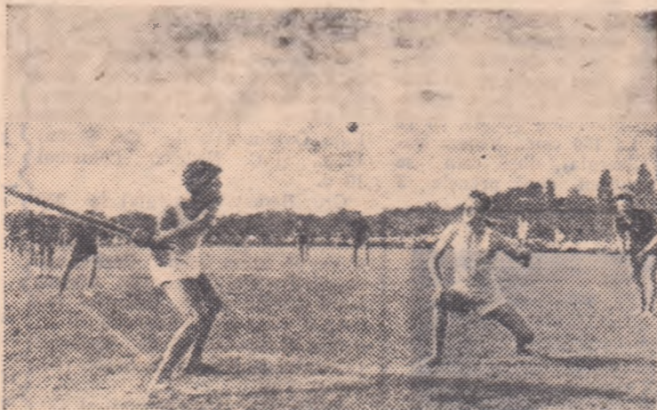
Jucătorii de oină din Osoi sînt acum la bătaie și mingea va fi lovită cu nădejde.

Dar iată și un alt lucru interesant pe care l-am aflat despre tinerii jucători de oină din regiunea Iași. Mulți dintre ei au lucrat la conducerea de apă Prut-Iași care a fost dată de curînd în folosință. Și cit de bine au lucrat — alături de ceilalți muncitori — acești harnici tineri: ne-o pot spune ieșenii care se bucură acum din belșug de roadele muncii lor.