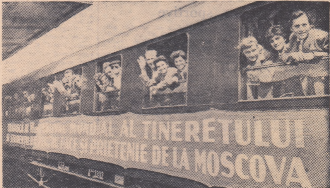
Trenul s-a pus în mișcare. De la fereastra vagonului baschetaliștii și baschetbalistele își iau rămas bun de la cei care au venit să-i conducă.

ORAȘUL STALIN (prin tele- fon). Pleacă sportivii! Cuvântul a- cesta era ieri dimineață, pe buzele mulțimii imense, care, încă de la ora 5, înșesase pur și simplu perso- nele gării din Orașul Stalin. O jumătate de oră mai târziu discul roșietic al soarelui începea să-și facă apariția de după crestele munților, dorind să întregască parcă atmosfera sărbătorească ce domnea pe peron.