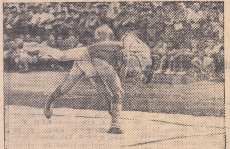
Care pe care? Iată întrecerea ce s-a purtat în acest moment între cei doi tineri, de față la interesanta luptă desfășurată între acești doi tineri.