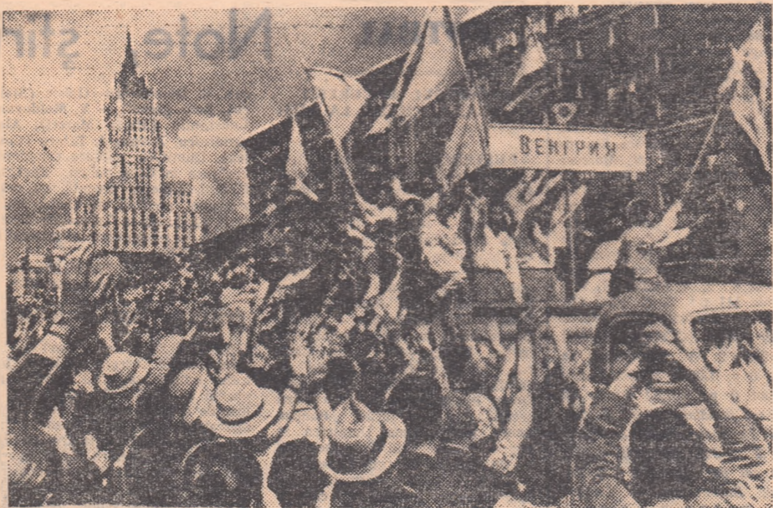
În drumul lor spre stadionul „V. I. Lenin” delegații R. P. Ungare formează obiectul unor vii manifestații de dragoste și simpatie