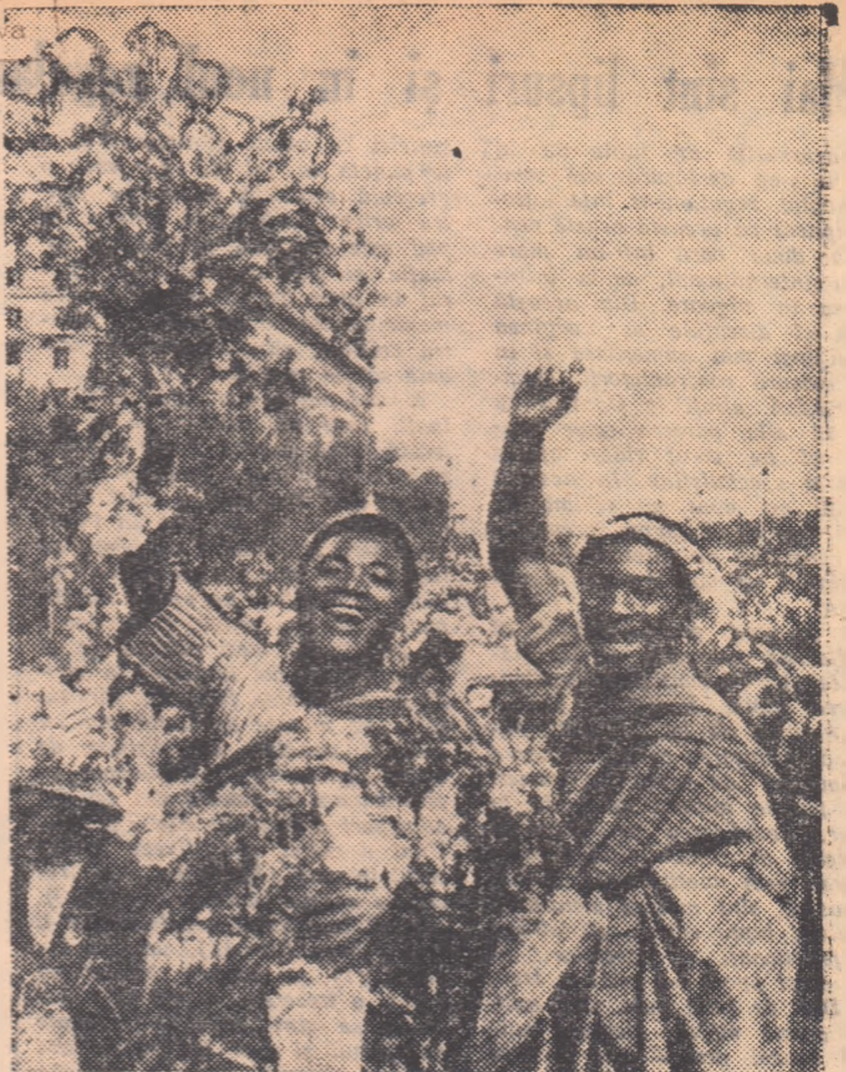
Prin coridorul viu format din zeci de mii de moscoviți trec delegații Africii Negre.

MOSCOVA 28 (prin telefon de trimișii noștri speciali).