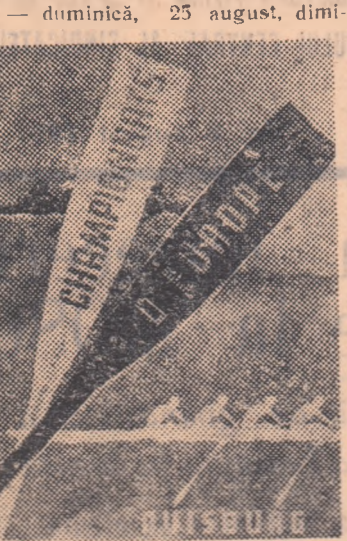
— duminică, 25 august, dimi-

ța: semifinale la caiac bărbați 500 m., caiac 2 bărbați 500 m., caiac 4 bărbați 1.000 m., caiac simplu femei 500 m.; după amiază: finale la: caiac 2 bărbați 10.000 m., caiac simplu bărbați 10.000 m., canoe dublu fond 10.000 m., canoe simplu fond 10.000 m., caiac simplu bărbați 500 m., caiac simplu femei 500 m., caiac 4 bărbați 1.000 m.