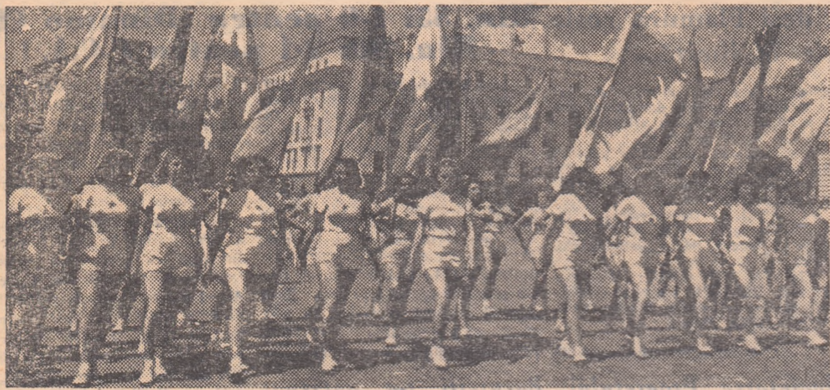
Tinere studente ale Institutului de Cultură Fizică din Sofia deștează pe strazile capitalei bulgare.

Se împlinesc 13 ani de când poporul bulgar, sub conducerea partidului său comunist, s-a ridicat la răscoală armată împotriva stăpînirii monarho-fasciste, scuturînd jugul la care era supus de asupritorii săi. Cu ajutorul frătesc al armatei sovietice, care urmărea pas cu pas ostiile hitleriste în derută, poporul bulgar și-a cucerit libertatea, deschizînd astfel zorii unei vieți noi și fericite. A 13-a aniversare a eliberării Bulgariei găsește această țară în plină înflorire. În anii de orînduire socialistă au fost obținute numeroase izbînzii în toate domeniile de activitate. Statul de democrație populară a creat de asemenea condiții favorabile dezvoltării culturii fizice și sportului în rîndurile maselor de tînet. Astăzi, sportivii bulgari se pot mindri cu nenumărate realizări, atît în