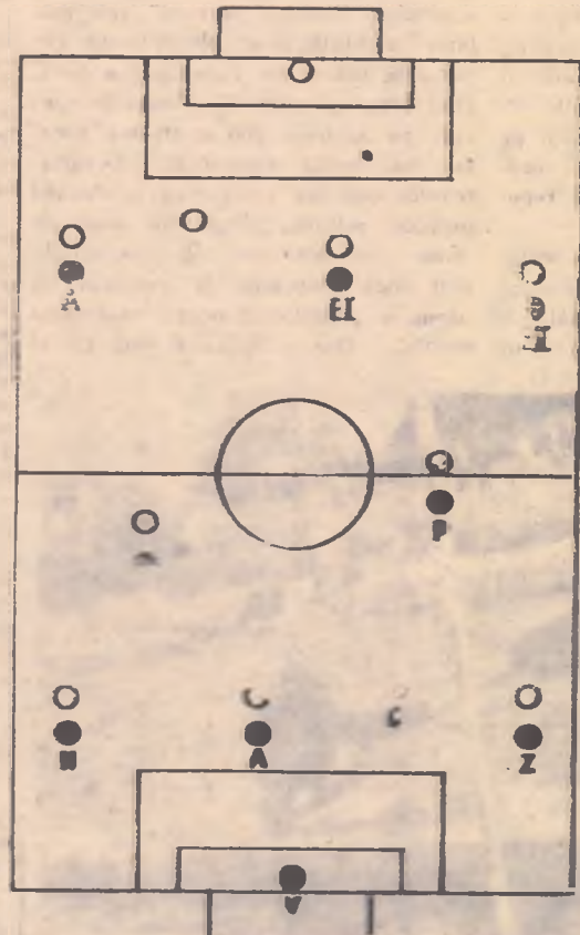
○ JUCĂTORII MAGLARI ● JUCĂTORII MOSTRI

Așa fiind, este evident că indicațiile date au fost juste și că nu se poate imputa nimic antrenorilor în această privință.