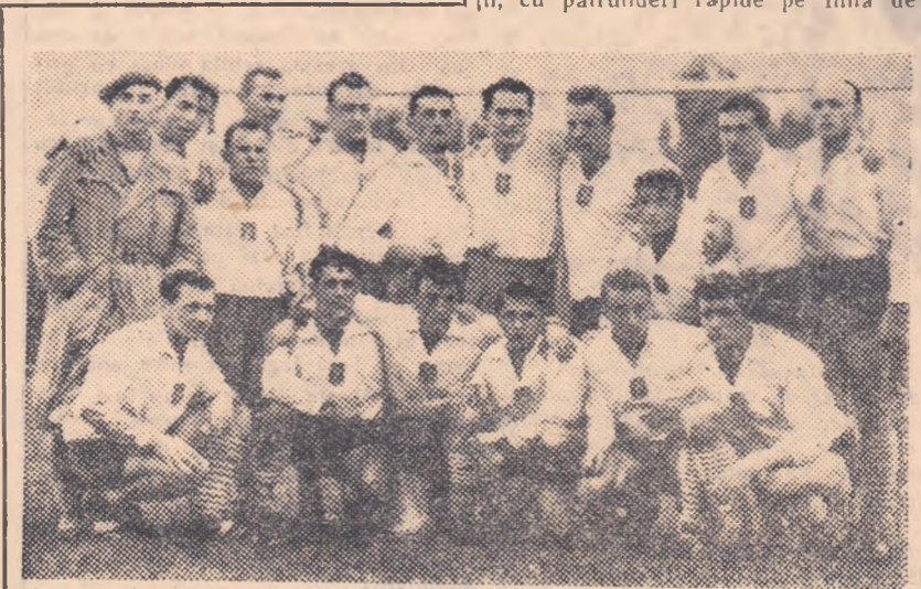
Selecționata de rugbi a orașului Varșovia după jocul cu Locomotiva Givița Roșie