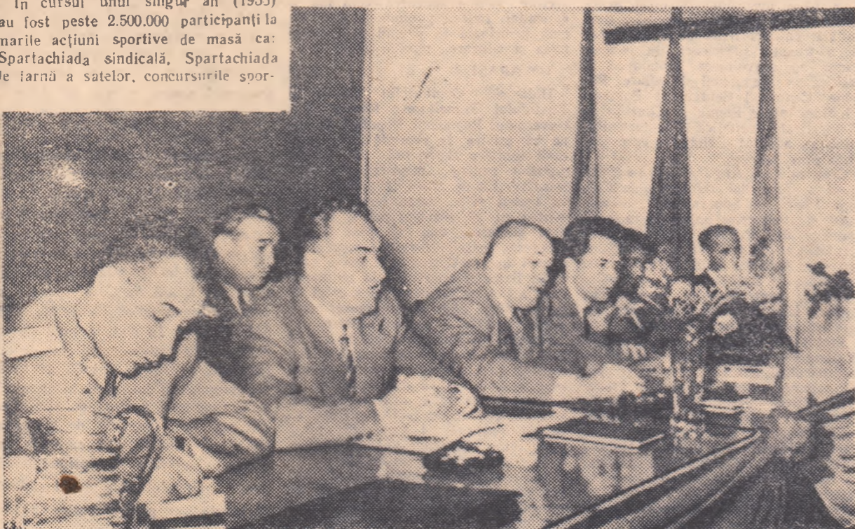
Prezidiul ședinței în timpul lucrărilor.

În ultimele întreceri pe care le-au susținut în Cehoslovacia baschetbalistele de la Energia Trustul 1 Construcții București au înregistrat următoarele rezultate: Energia — Slovan Bratislava (clasată pe locul cinci în prima ligă) 56-35 (24-17), Energia — selecționata Bratislava 33-38 (19-19). Sportivele romîne au mai susținut sub numele selecționata București o partidă cu selecționata Brno de care au fost învîrșite cu 48-53 (28-27). De subliniat că deși au disputat 11 jocuri în 13 zile, fapt care cere un efort deosebit, baschetbalistele de la Energia au avut o comportare foarte bună, cîștigînd majoritatea întîlnirilor.