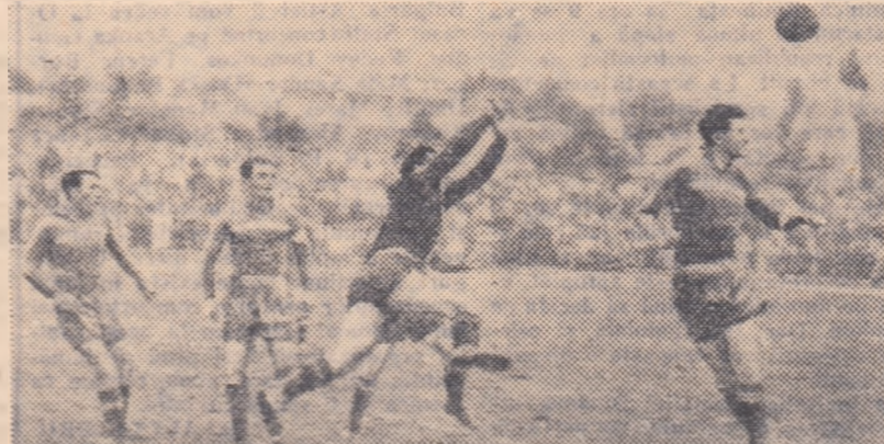
Fază la poarta echipei Energia Orașul Stalin în meciul cu Dinamo București.

Și de la 1-0 s-a ajuns la 1-1 (23 de minute după începerea reprizei a doua); iar cu 10 minute înainte de sfârșit Zaharia a înscris cu capul punctul victoriei. Dinamoviștii au ratat însă de puțin egalarea: Mihai a tras alături de poartă părășită de Ștefan. În concluzie (pentru a căta oară?...): un meci durează 90 de minute, un gol n-a fost aproape niciodată suficient pentru asigurarea victoriei și el în nici un caz nu poate fi apărut prin joc defensiv. Cine are urechi să audă!