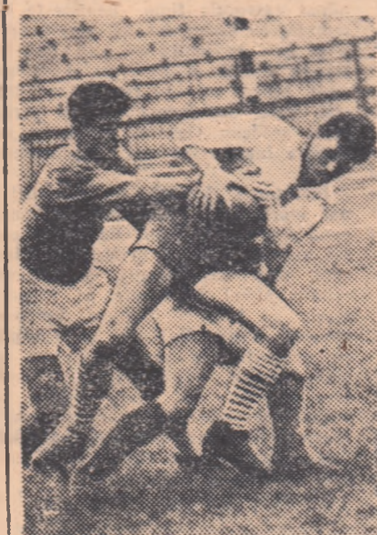
Plin de hotărîre, înaintașul polonez va scăpa din placaj. Fază din întîlnirea București Tineret — Varșovia. 9—6.