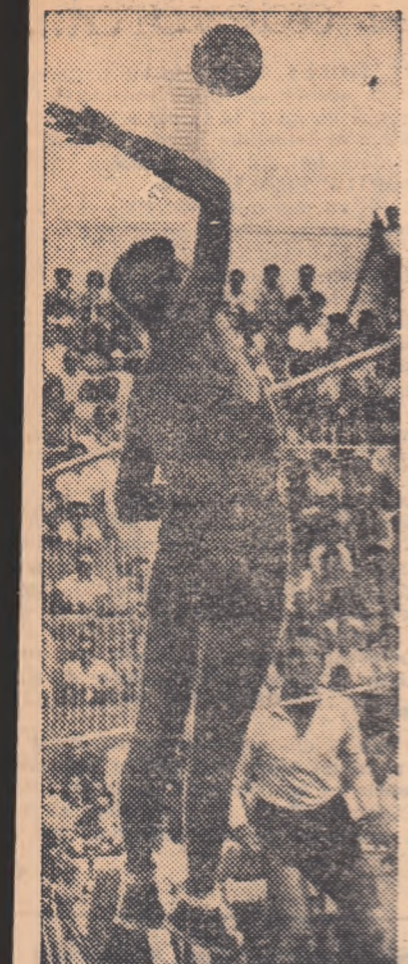
Iubitorii voleiului vor putea aplauda din nou, peste câteva zile, numeroase faze de spectacol superior, asemenea celei din ilustrația de mai sus. Încep campionatele republicane!