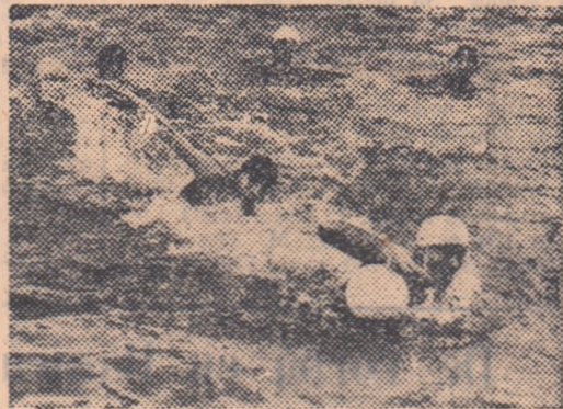
Un spectaculos contraatac al selecționatelor de tineret a Iugoslaviei în meciul cu echipa Poloniei.

Turneul continuă azi de la ora 17 la bazinul „Dante Gherman” cu următoarele meciuri: Olanda—România, Polonia—Ungaria, R.D. Germană—Iugoslavia.