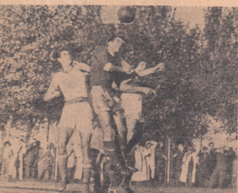
Sever (Locomotiva Constanța) în luptă aeriană pentru balon cu trei apărători ai echipei Dinamo 6.

Victoria gazdelor este pe deplin meritată. Față de perioada insistență de dominare și de situațiile de gol