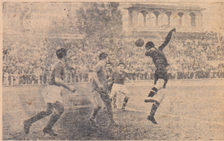
Fază din meciul Selecționata divizionară—Progresul București

dat fiind faptul că programul echipei noastre naționale (cel oușin în preliminariile campionatului mondial) a fost cunoscut cu multă vreme în urmă era cazul să se ia contact de atunci și cu diferite cluburi de peste hotare spre a se evita refuzurile de ultimă oră cu care avem de-a face acum. Să sperăm că se vor trage concluziile ce se impun și — mai ales — că se vor lua măsurile de rigoare.