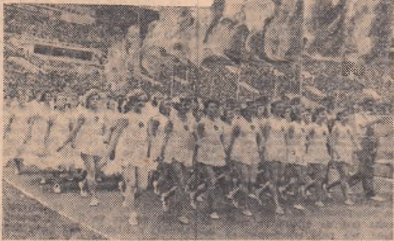
Viitorul de aur al sportului sovietic. Tinerii din asociația Rezervele de Muncă defilează pe marele stadion de la Lujniki. Demonstrația lor de gimnastică cu prilejul deschiderii Jocurilor Tineretului a rămas neuitată în amintirea tuturor spectatorilor

Cu 40 de ani în urmă tinărul stat sovietic prelua de la țarism și în domeniul sportului o moștenire săracă și ingrată. De fapt nu se putea vorbi despre o activitate sportivă organizată în Rusia dinaintea Revoluției. Și iată că în numai 4 decenii primul stat socialist din lume cucerește supremația în acest domeniu. La ora actuală în U.R.S.S. există la fiecare 7 locuitori un sportiv, participant activ și continuu la mișcarea de cultură fizică.