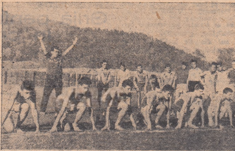
Pe terenul de sport al colectivului Energia din Ofelul Roșu se organizează în cinstea zilei de 7 Noiembrie numeroase concursuri de trecerea normelor G.M.A. În fotografie un grup de aspiranți G.M.A., elevii ai școlii profesionale din Ofelul Roșu își trec ultima normă, cursa de 100 m. plat.

Turiștii din Regiunea Autonomă Maghiară vor avea prilejul să-și arate buna lor pregătire în cadrul unui important concurs de orientare turistică, organizat de către colectivele sportive Flamura roșie „Bernat Andrei”, „Petofi Sandor” și „Ludo ic Minski”. Concursul, dotat cu „Cupa 7 Noiembrie”, se va desfășura în împrejurimile Reghinului, în zilele de 21 și 22 octombrie. (Ioan Păuș, corespondent).