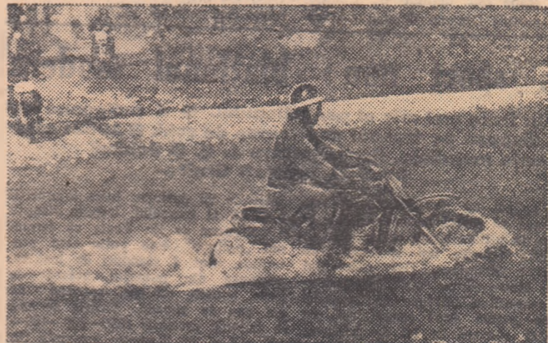
Trecerea prin vaduri de ape este un aspect frecuent în probele de motocros