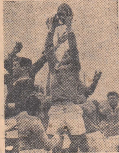
Fază din întîlnirea de rugbi Energia I.S.P.—Dinamo București (semifinala Cupei R.P.R.). Obținînd victoria cu 3-0, „construcții” s-au calificat pentru finală...

an mai tîrziu — în 1956 — tinerii de la M.T.D. joacă în finala campionatului de juniori, pierzînd onorab... însă în fața redutabilei formații a juniorilor de la Locomotiva Gr. Roșie. Dar, juniorii au crescut... și în acest an au promovât în categoria B. Aici, Energia M.T.D. s-a arătat a fi o echipă constantă, obținînd rezultate meritorii în compania celor mai bune formații din seria respectivă. (În prezent ea ocupă locul I. la egalitate de puncte cu Știința I.M.F. și Energia Mine, anunțîndu-se drept o pretendentă serioasă la un loc în prima categorie)