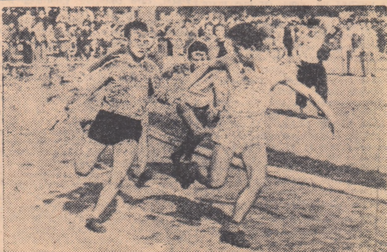
Un dinamic schimb de ștafetă pe stadionul Tineretului.

Iată de altfel și câștigătorii probelor din calificări: BĂIEȚI: 80 m. plat — M. Bourceanu (Sc. med. 11) 10,8 greutate — M. Niculescu (Sc. med. 7) 11,05 m.; lungime — N. Rădulescu (Sc. med. 13) 5,74 m.; înălțime — S. Popescu 1,45 m.; 100 m. plat — S. Bălăceanu (Sc. med. 11) 11,7; 800 m. — N. Prăjescu (Sc. med. 18) 2:17,5. FETE: 80 m. plat — Căpitanescu (Sc. med. 26) 11,6; 100 m. plat — R. Rădulescu (Sc. med. 7) 14,6; 400 m. — E. Dumitrescu (Sc. med. 7) 1:15,0; lungime — ca I-a F. Olteanu (Sc. med. 7) 3,75 m. cat. II-a A. Căpitanescu 3,97 m. greutate, cat. II-a — M. Stancu (Sc. med. 10) 7,92 m.; cat. I-a S. Crisvelone (Sc. med. 7) 7,90 m.; inițime — cat. I-a I. Rădulescu (Sc. med. 7) 1,15 m.; cat. II-a C. Paiev (Sc. medie 7) 1,20 m.