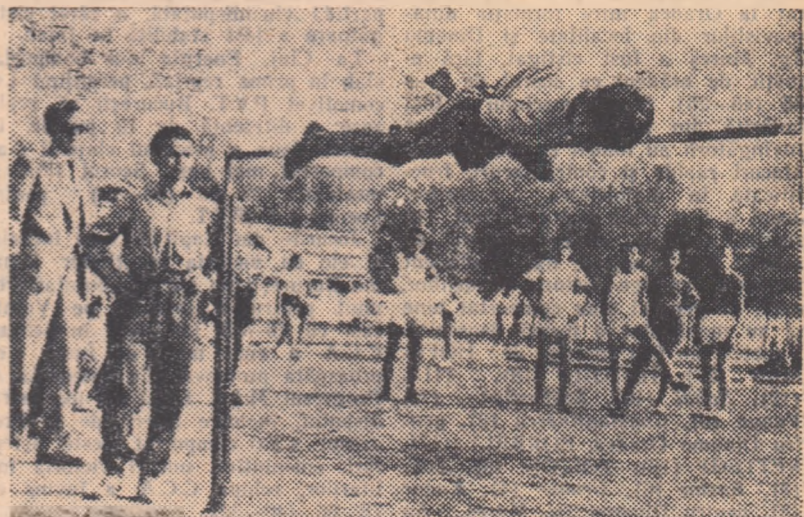
Am fost surprinși de numărul tinerilor care și-au disputat înălțimea la săritura în înălțime și de buna pregătire a unora dintre ei. Trebuie să recunoaștem că o astfel de săritură, la un copil de 13 ani, nedă tot dreptul să sperăm...

„O zi excepțională pentru atletism” au spus ieri toți cei care au asistat la preliminariile concursului atletic organizat de ziarul „Sportul popular”, referindu-se atât la frumusețea zilei cât mai ales la numărul de peste 2000 de elevi și eleve care s-au întrecut pe trei dintre cele mai mari stadioane bucureștene. Sintem nevoiți să redăm foarte succint cele petrecute de-a lungul unei dimineți de intreceri atletice entuziaste, emoționante uneori, și soldate deseori cu rezultate care, fără îndoială, vor atrage atenția antrenorilor de specialitate.