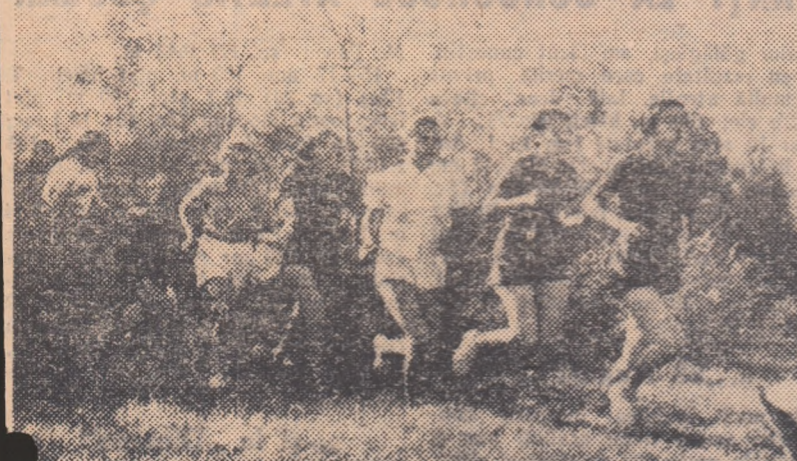
Traseul etapei a treia a crosului „Să întimpinăm 7 Noiembrie” a fost bine ales de comisia de specialitate din București. Iată un grup de concurenți junioare la ieșirea dintr-o alea a parcului „23 August”.