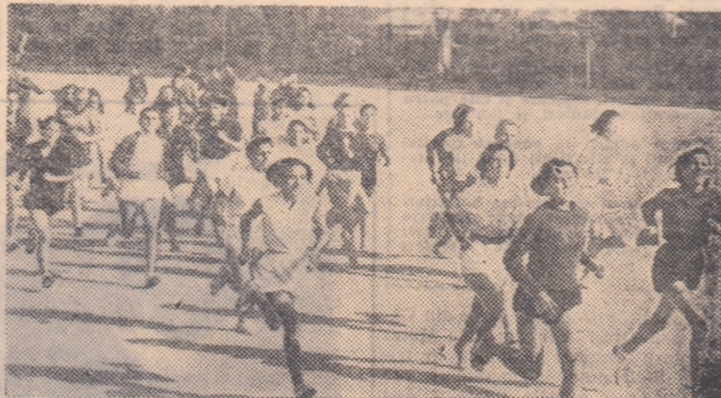
Aspect de la competiția de cros „Să întâmpinăm 7 Noiembrie”. — proba junioarelor din cadrul fazei regionale București. Cele mai bune dintre concurenți vor putea fi văzute și la startul întrecerii finale de duminică.

● Următorul popas al Ștafetei va fi în localitatea Pașcani. Aici, în ziua de 3 noiembrie, reprezentanții tineretului din regiunile Bacău și Suceava vor preda Ștafeta și mesajele de salut reprezentanților tineretului regiunii Iași.