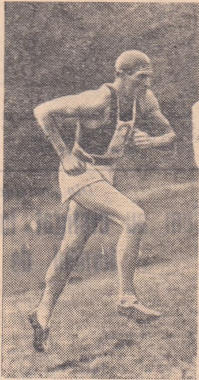
Igor Novikov (U.R.S.S.) campion mondial de pentatlon modern pe anul 1957.

STOCKHOLM, 30 (prin telefon). — Un adevărat triumf al pentatlonului sovietic — astfel pot fi caracterizate rezultatele finale ale campionatului mondial de pentatlon modern pe anul 1957. Campioană mondială: echipa U-