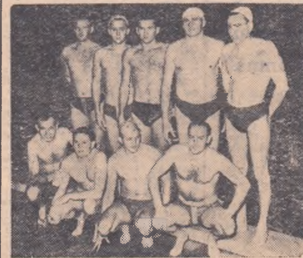
Echipa maghiară Dozsa Szolnok, campioana Ungariei în anii 1954 și 1957