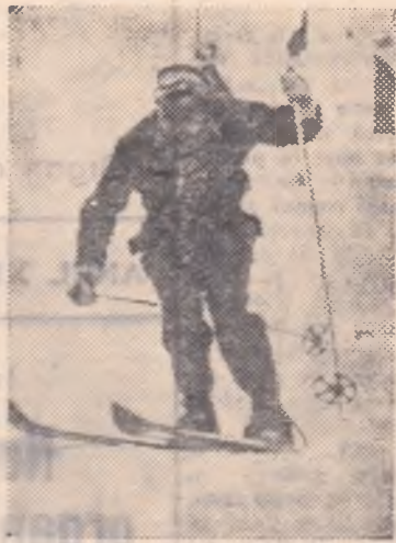
Atacînd o poartă...

— „Desigur că nu acesta e nodul gordian. În schi, un adversar de seamă al concurentului este pirția. Or, dacă ai în permanență același adversar, te obișnuiești cu el, iar cînd dai de altul ești surprins. De aceea, sînt necesare mai multe pirții cu mare grad de dificultate și bine îngrijite. Schiorii romîni trebuie să ai-