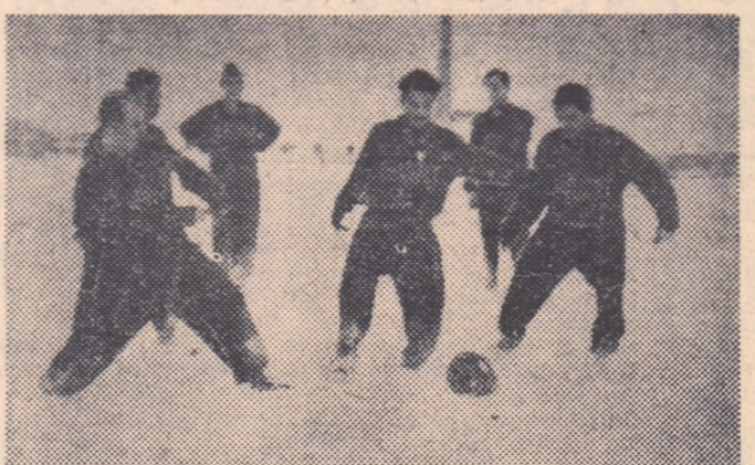
La „Quadrat” fotbalul este atât de îndrăgit încît este practic și iarna. Dar el a încetat să fie singurul „copil” al colectivului sportiv. Voleiul, șahul, gimnastica și alte discipline atrag din ce în ce mai mulți salariați pe arenele sportive.