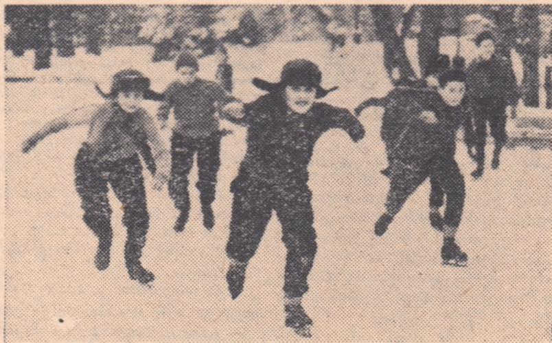
Primul contact cu gheața alunecă și prilejuiește, după cum se observă, multă satisfacție micilor patinatori