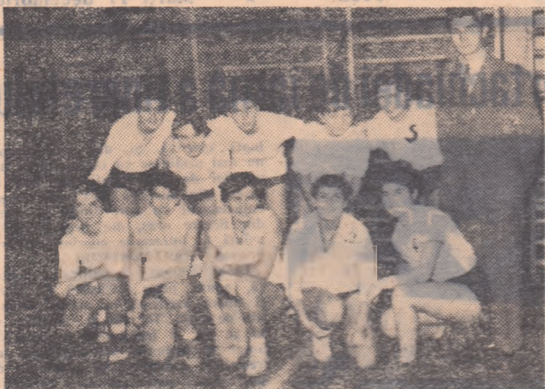
Echipa feminină a orașului București, cîștigătoare a competiției școlare dotată cu „Cupa comisiei centrale de volei”.

FEMININ, loc 1-2: București — Ploiești 3-0 (8, 3, 5); loc 3-4: Craiova-Orașul Stalin 3-2 (16-14, 4-15, 15-4, 13-15, 15-7); loc 5-6: Cluj-Galați 3-0 (6, 7, 12); loc 7-8: Tg. Mureș — Timișoara 3-2 (14-16, 15-13, 15-9, 7-15, 17-15). Clasament final: 1. BUCUREȘTI; 2. Ploiești; 3. Craiova; 4. Orașul Stalin; 5. Cluj; 6. Galați; 7. Tg. Mureș; 8. Timișoara