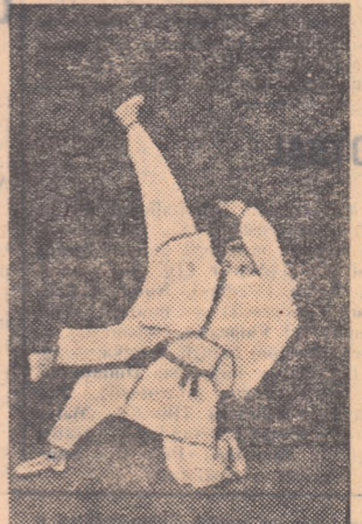
O acțiune care demonstrează cît de spectaculos este judo-ul

sandan, yodan, godan, kohudan, shichidan, hachidan, kudan, judan).