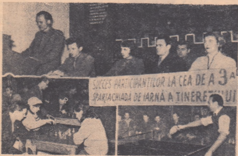
Aspect de la deschiderea Spartachiadei de iarnă a tineretului la fabrica de confecții Gheorghe Gheorghiu-Dej din Capitală. După festivitățile de deschidere au avut loc concursuri de tenis de masă și șah.