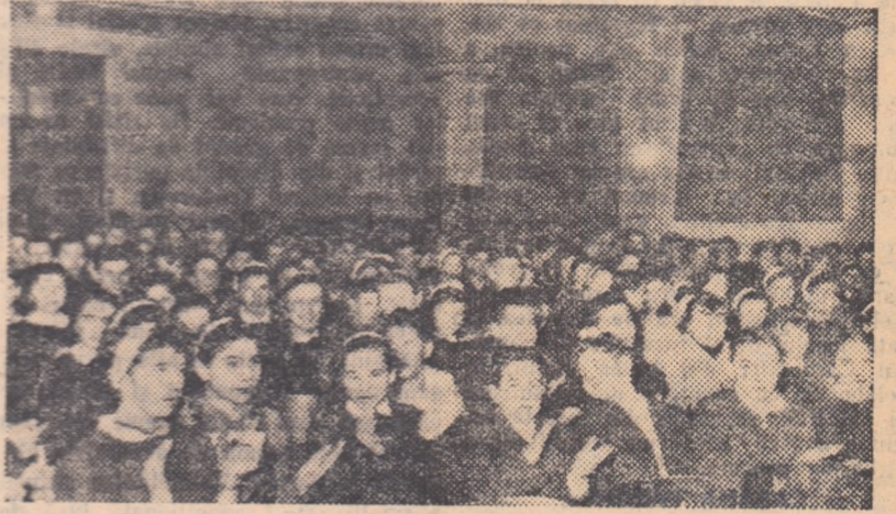
Un aspect de la adunarea generală a elevilor școlii medii nr. 20 „Gh. Șincai” cu prilejul alegerii noului consiliu sportiv.

Deși inițial ne-a fost în intenție să urmăm paratol cu desfășurarea adunării generale a elevilor de la școala medie nr. 20 și aceea a elevilor școlii medii nr. 12 Spiru Haret, totuși preocuparea diferită care a existat în jurul acestui important eveniment ne-a împiedicat să dăm curs acestei intenții. O spunem fără înconjur: la școala medie nr. 12 re-