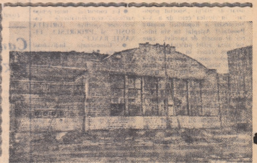
Bazinul acoperit din Reșița mai era încă în plină construcție acum câteva luni. Și iată că astăzi, gata finisat, el stă la dispoziția sportivilor reșițeni, ca și multe alte baze sportive moderne

înot. Numai privind aceste cifre, oricine își poate da seama de avîntul mișcării noastre de cultură fizică și sport, de considerabila creștere a bazei materiale a sportului nostru. Și încă trebuie spus că în aceste cifre nu sînt cuprinse cele peste 2000 de baze sportive simple de la orașe și sate pe care pulsează o viață sportivă intensă și organizată!