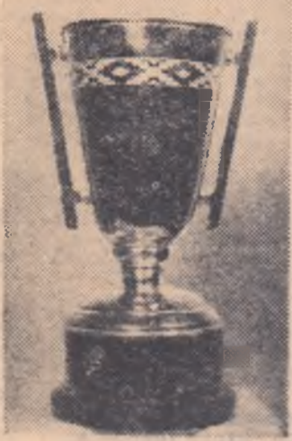
Micul trofeu cu care redacția ziarului nostru a înzestrat întrecerea tinerilor baschetbaliști.

Și baschetbaliștii au ocazia în aceste zile să se întrecă în cadrul unui concurs organizat în cinstea marelui sărbători a țării noastre. „Cupa 30 Decembrie”, organizată de Uniunea de Cultură Fizică și Sport prin comisia de baschet, cu sprijinul direct al Ministerului Învățământului și Culturii, se desfășoară între 1—29 decembrie, cu participarea școlărilor de toate gradele, înscriși în anul școlar 1957—1958 și având vârsta maximă de 18 ani (adică născuți până în anul 1939). Competiția are menirea de a angrena într-o activitate organizată un număr cât mai mare de elemente din rândurile tineretului studios și este înzestrată cu o cupă oferită de ziarul „Sportul popular”, precum și cu numeroase plăchete și diplome. Dar interesul întrecerilor va fi asigurat mai puțin de aceste premii și mai mult de dorința celor care nu s-au afirmat până acum în concursuri oficiale să și arate talentul, posibilitățile