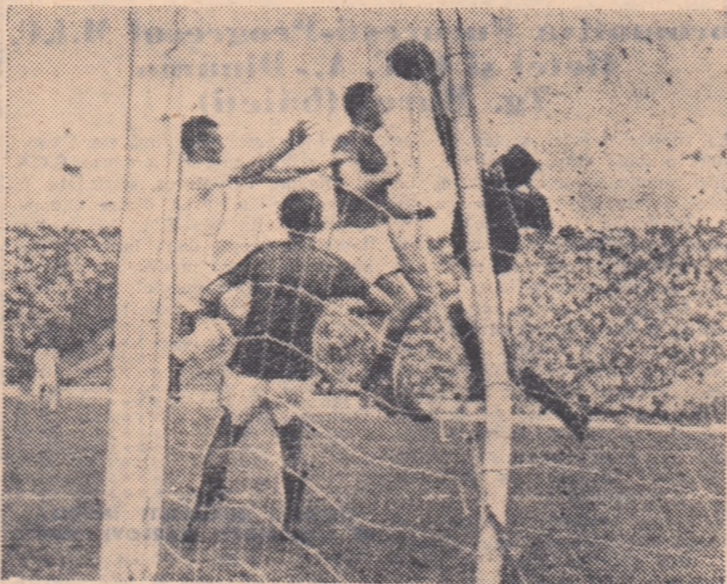
O jază din jocul Dinamo București — Dinamo Cluj desfășurat în toamnă pe stadionul „23 August”.

Jocuri internaționale care să compenseze lipsa celor de campionat nu se pot perfecta atunci când vrem noi. Ne