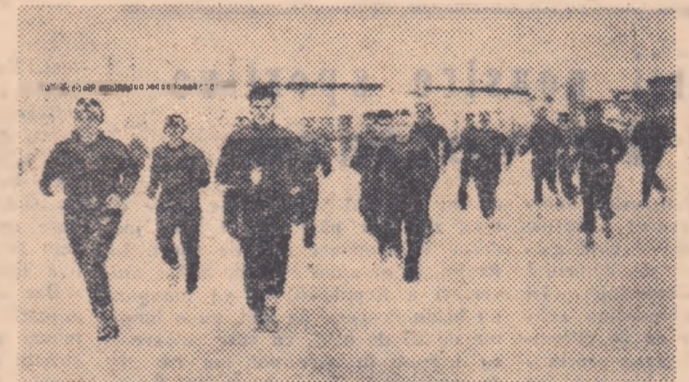
Ultimele pregătiri înaintea plecării în Italia. Fotbaliștii Casei Centrale a Armatei fac un tur în jurul terenului înainte de a trece la ședința de pregătire propriu-zisă.

— Ce ne puteți spune despre meciul de la Bologna?