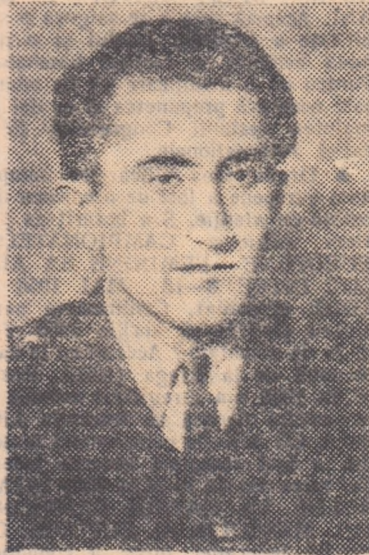
T. Petrosian — câștigătorul semifinalei de la Kiev.

Si astfel se cunosc de acum 17 participanți la marea întrecere. Al 18-lea este de drept campionul țării Mihail Tal. Ultimii doi, dină la completarea numărului de 20, vor fi invitați ai Secției Unionale. În orice caz se dă ca precisă știrea neparticipării lui Smislov și Botvinnik ocupată cu pregătirea meciului revanșă pentru campionatul lumii. Este deci probabil să intre în finală Keres și Bronstein. În orice caz competiția care se va deschide la începutul anului viitor se anunță palpitantă.