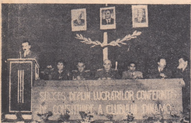
Un aspect de la lucrările conferinței de constituire a primului club sportiv din țara noastră — Dinamo București.