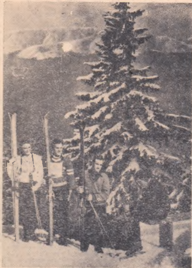
Fotomontaj de I. MIHAICA