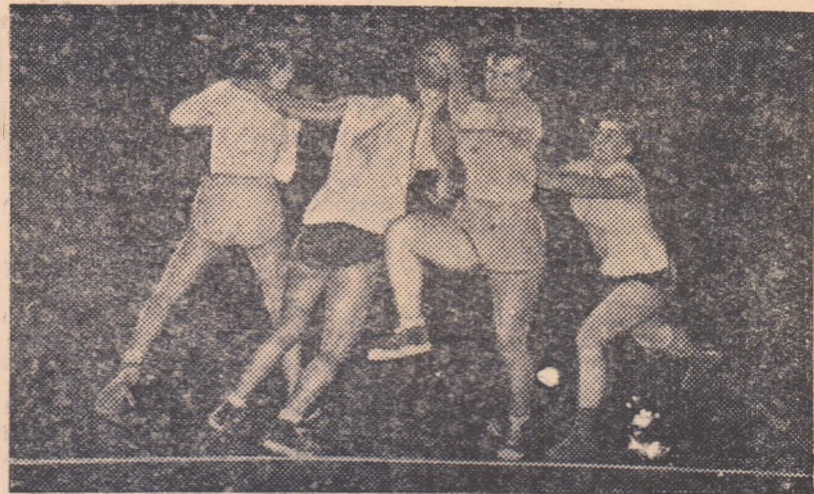
O fază caracteristică din primul meci Locomotiva Virovitica — Steagul Roșu. Ce părere aveți despre această „tactică” în apărare, folosită de jucătoarele bucureștene?

I. Sampdoria-Florența (camp. italian) — înfrîngerea suferită duminică în fața Atalanta a trimis-o pe Sampdoria în plină zonă expusă retrogradării. Iată de ce sîntem convinși că va depune toate eforturile pentru a înregistra o victorie în fața Florenței. Valoarea oaspetilor ne determină totuși să luăm ca pronostic de bază „X”-ul. II. Napoli-Milan (camp. italian). Napoliștii sînt mult prea buni acum pentru a nu le acorda totuși prima şansă. Deci „1” și „X”. III. Juventus-Ucinese (camp. italian). O înfrîngere în care avem locului să indicăm un solist Juventus. Într-adevăr,