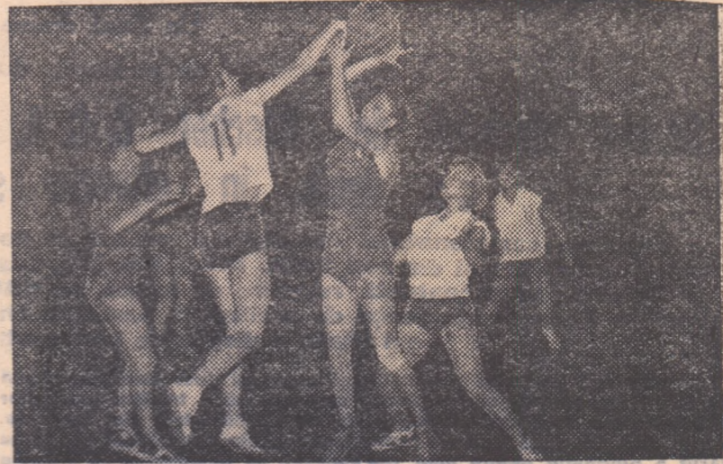
Lupta îndrăgănită pentru fiecare minge (ilustrată și în imaginea de față, luată la partida Știința I.O.F. — Progresul Oradea) caracterizează de obicei — în lipsa tehnicii înalte — majoritatea întrecerilor, de baschet feminin de la noi.

Iar în noile condiții, exigențele noastre, ale tuturor nu pot fi decît mai mari ca pînă acum.