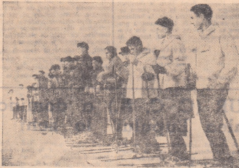
Duminică s-au desfășurat în Capitală mai multe concursuri de schi, patinaj și săniuțe. În fotografie: pri mii concurenți din raionul I. V. Stalin care s-au întrecut la schi în parcul Herăstrău.