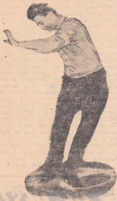
KAREL DIVIN, noul campion european la patinaj artistic.