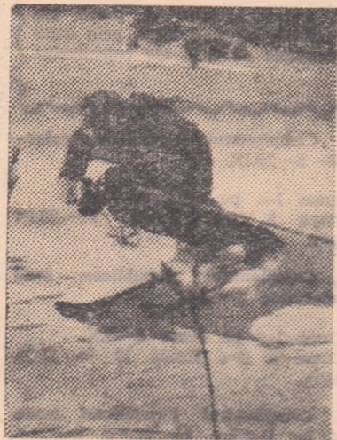
în plin acțiune.

din vreme de amenajarea pîrtiilor. Pîrtia Lupului, pentru coborire, Suli-narul, pentru slalom uriaș și pîrtia de sub teleferic nu au fost curățate din timpul verii sau toamnei și acum nu