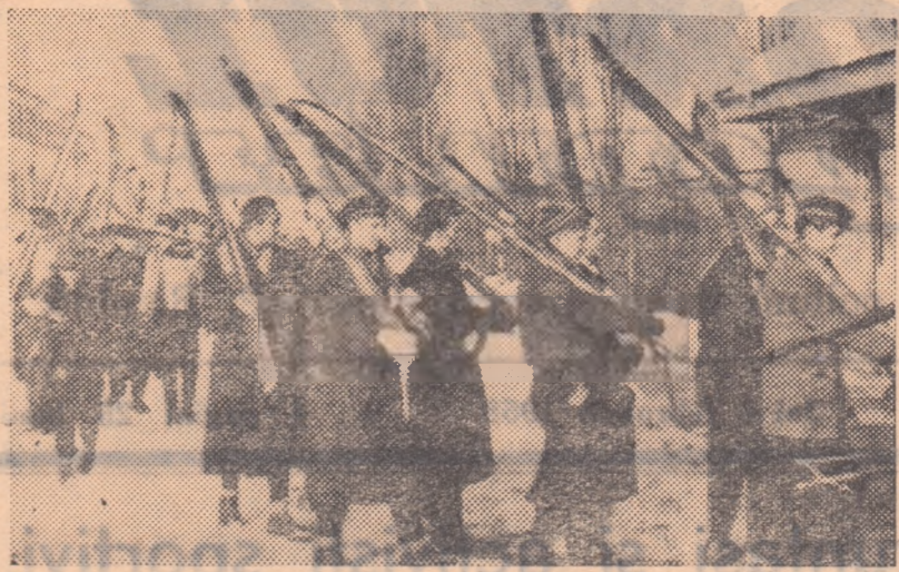
Sute de tineri au participat în ultimul timp la frumoase întreceri de schi, organizate în cadrul Spartachiadei de iarnă. În fotografia noastră puteți vedea un grup de elevi ai școlii nr. 4 Aurel Vlaicu din Bucești, îndreptându-se spre locul de concurs

Ultima din seria de scrisori pe care vi le prezentăm astăzi este aceea a corespondentului nostru din Cluj, Al. Mornete. El ne trimete o amplă analiză a felului în care s-au desfășurat întrecerile din cadrul