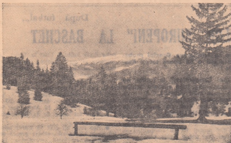
Munții Gârbova văzuți din Sinaia

cut de la 363 la peste 500, pînă la finele lunii ianuarie 1958. Acum se desfășoară activitatea în secțiile: bob, cu un număr de 36 sportivi; schi — 120; lupte clasice și libere — 120; șah — 45, precum și în secțiile fotbal și turism, cit despre popice, ele sînt un adevărat sport de masă, fiind practicate de sute de angajați ai uzinei. Boberii, schiorii și luptătorii se pregătesc intens pentru campionate. Prin-