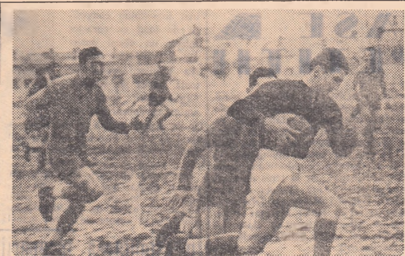
După dirzenia pe care o arborează, s-ar părea că Sava (I.C.S.P.C.) „merge” decis să marcheze. În realitate, simplă iluzie optică, deoarece „constructorii” nu au fructificat nici un din ocaziile avute.