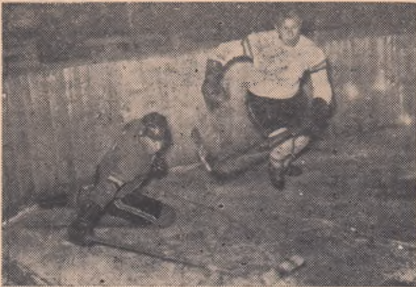
Fază din primul joc al programului de hochei de aseară: București—București (tineret)