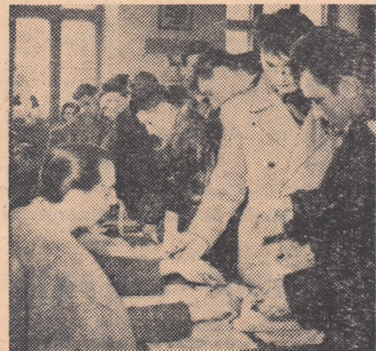
Jucătorii de hochei primesc buletinele de vot

Prima clasată din fiecare grupă se califică pentru semifinale.