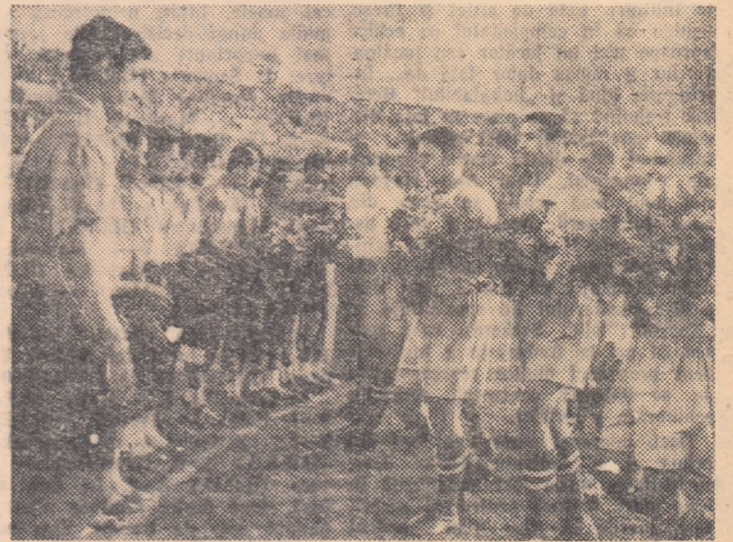
La Moscova, pe stadionul Dinamo, echipa indiană East Bengal Club primește buchete de flori din partea fotbalistilor formației sovietice Torpedo. Meciu, care a urmat a luat sfîrșit cu un rezultat de egalitate 3-3.

bucurătoare și nu trebuie prea mult optimism ca să-ți dai seama că în viitorul apropiat India va juca și pe plan sportiv un rol important în lume, așa cum îl joacă în domeniul politicii internaționale și îndeosebi al luptei pentru pace și colaborare între popoare.