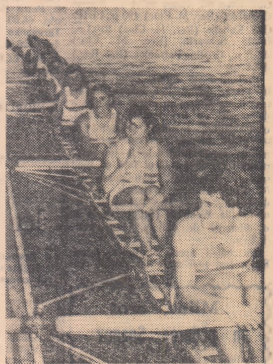
Numeroase sportive frunțase ne-au adus bucuria unor valoroase performanțe care au făcut să crească prestigiul sportiv al patriei noastre peste hotare. În fotografie: echipajul feminin de schi 8+1, de patru ori consecutiv vicecampion european.

Am epuizat oare tot ceea ce se poate spune despre rolul și aportul