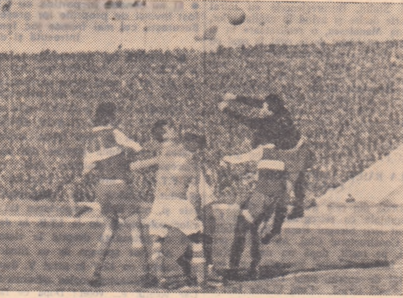
Ușu boxează peste un grup de coechipieri și adversari

● O singură gazdă, din șase!, învingătoare: Jiul Petroșani. ● Ciosescu a stabilit ieri un mic record