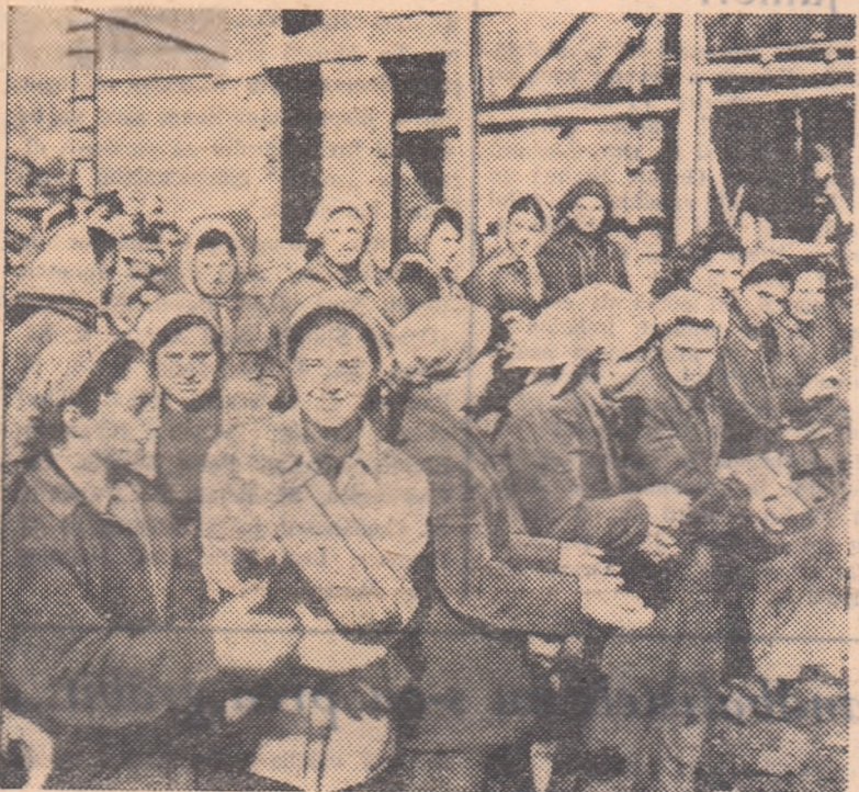
Tineretele țete au fost prezente în mare număr la acțiunile organizate în cadrul „Zilei muncii voluntare“.

Ultimele vești ne vorbesc despre aceeași entuziastă participare la „Ziua muncii voluntare“ a sportivilor din alte regiuni cum ar fi Suceava, Pitești, Constanța, Galați unde în special la sale au fost amenajate terenuri simple de volei, baschet, fotbal sau handbal a căror inaugurare tinerii din aceste regiuni ca și din alte părți ale țării o vor face desigur miine, în cadrul ultimei zile a Săptămîinii Mondiale a Tineretului cu prilejul căreia se vor organiza în întreaga țară numeroase întreceri sportive.