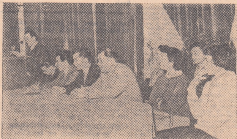
„Aspect de la ședința de constituire a clubului sportiv universitar din Capitală.