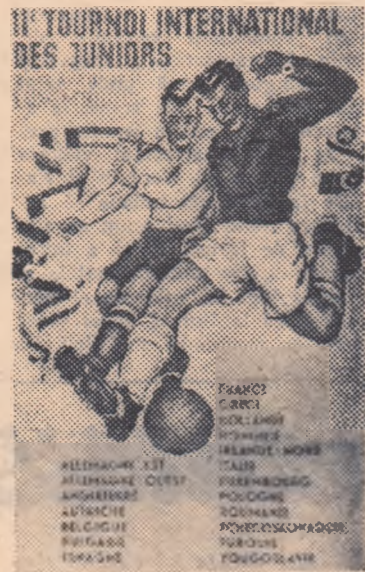
Afișul Turneului Internațional de Juniori — ediția 1958

gătire diferit cu care s-au prezentat juniorii în lot. Mi-am dat seama că în colective au fost insuficient pregătiți. Munca de pregătire în lot a dat unele rezultate bune în timpul scurt avut la dispoziție, mai ales ca omogenizare din punct de vedere al pregătirii. Atacul a dovedit mai multe progrese în raport cu modul cum s-au prezentat în lot. Sperăm însă ca la