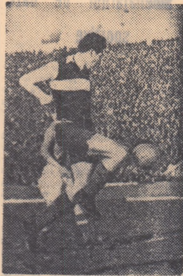
Ciocioscu în dină cursă spre poartă

... dar jocurile mai importante se dispută la Ploești și Tg. Mureș Cîteva noutăți interesante în formații