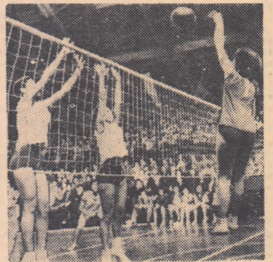
Fază din meciul feminin de volei M.I.G. București — Ganz-Budapesta, terminat cu victoria meritată a bucureștenelor: 3—2

Victoria a revenit după o luptă care a durat aproape două ore, în cinci seturi, jucătorilor de la C.T.F.T.: 3—2 (15—13, 10—15, 15—17, 15—6, 15—6).