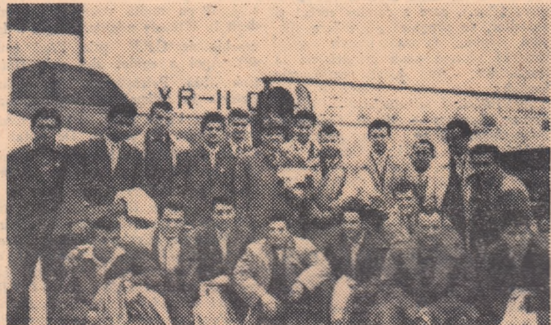
Echipa națională de juniori la cîteva minute după coborîrea din avion

francez, a produs o puternică impresie în cercurile sportive din întreaga lume.